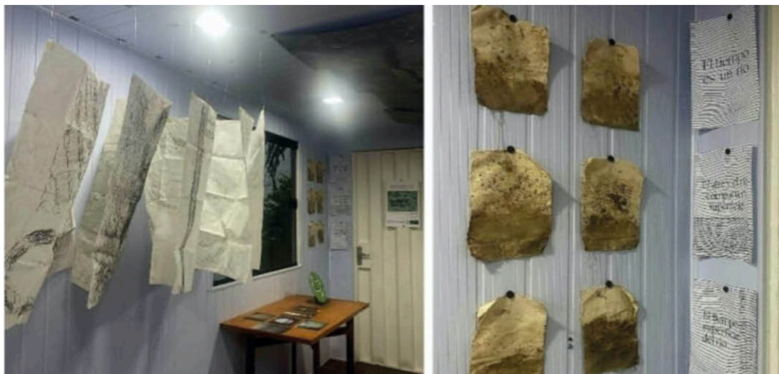
Obras realizadas durante la residencia flotante Deixis del río, Paraguay.