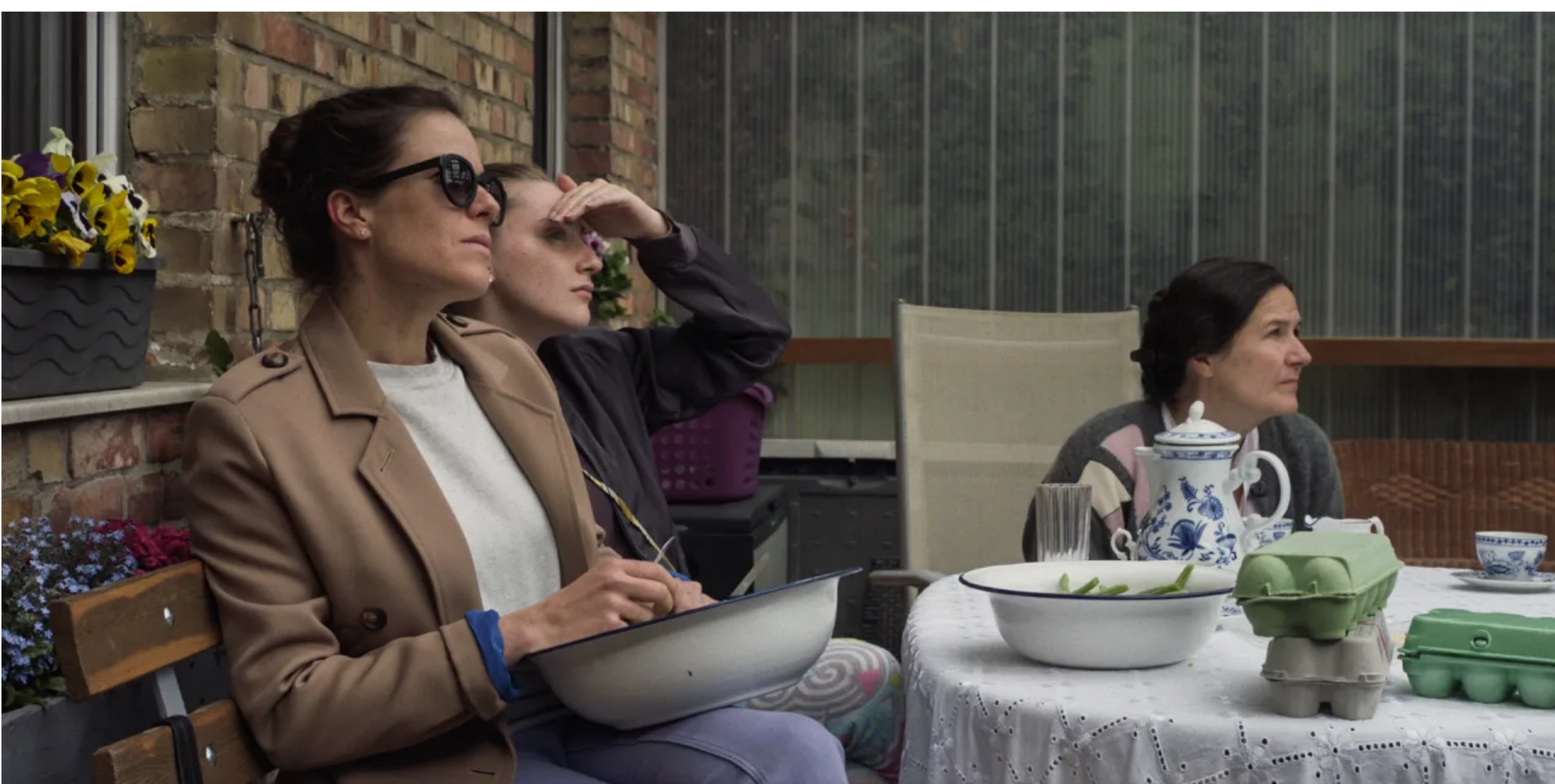
Escena de "Todos hablan sobre el tiempo".

Está disponible, gratuitamente, en la plataforma Goethe on Demand, la película alemana Todos hablan sobre el tiempo , presentada por el Goethe Institut y el Instituto Cultural Paraguayo Alemán.