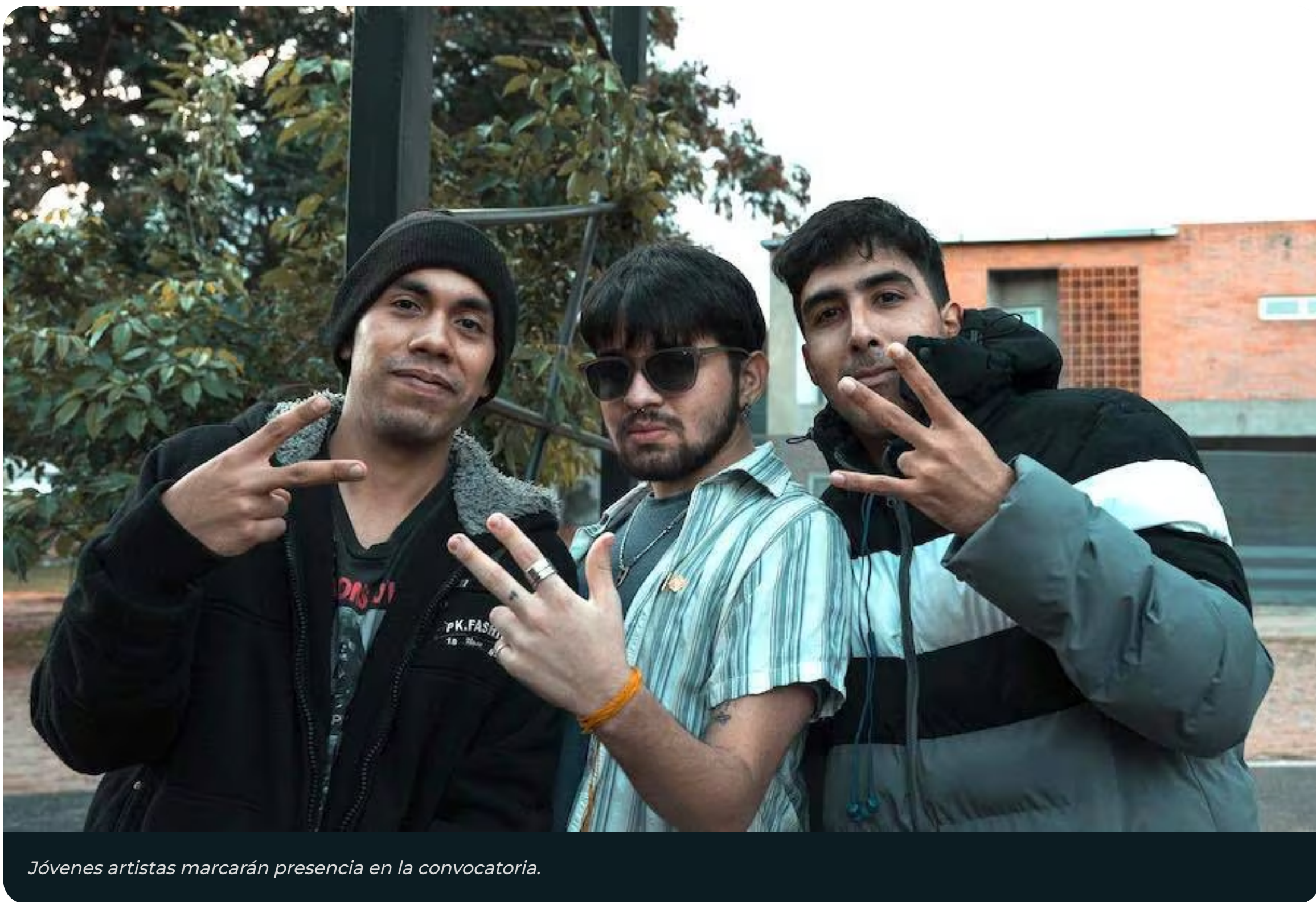
Jóvenes artistas marcarán presencia en la convocatoria.