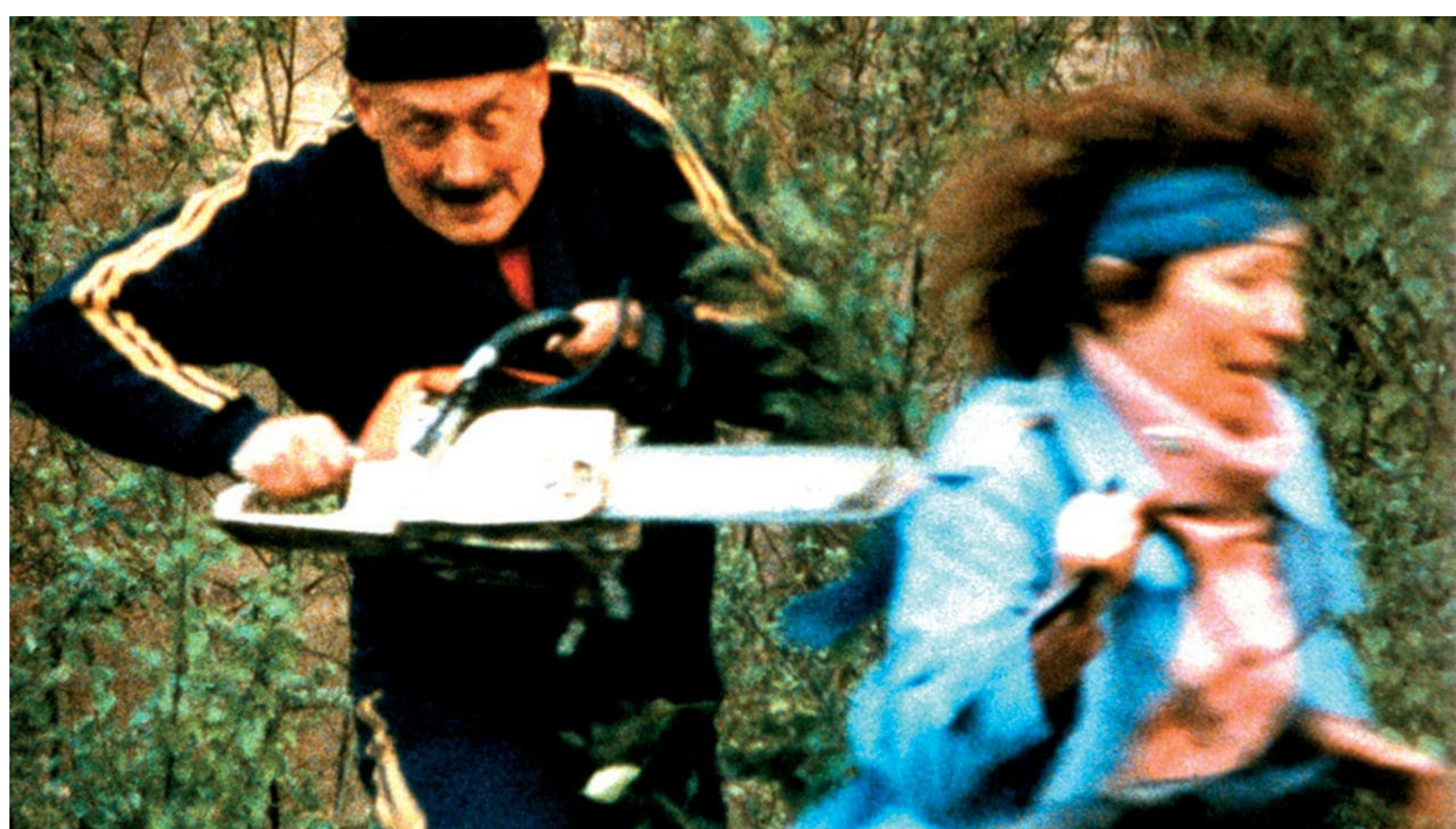
Escena de "La masacre alemana con motosierra". Cortesía

El Goethe-Institut, en colaboración con el Instituto Cultural Paraguayo Alemán Goethe Zentrum (ICPA-GZ), ofrece gratuitamente lo mejor del cine alemán a través de la plataforma Goethe on Demand. Esta semana está disponible "La masacre alemana con motosierra", dirigida por Christoph Schlingensief. Se trata de una película de 1990 que aborda, de manera satírica y en lenguaje de terror, el momento de la caída del muro de Berlín y el comienzo de la reunificación alemana. De 63 minutos de duración, está hablada en alemán, con subtítulos en español, inglés, francés y portugués.