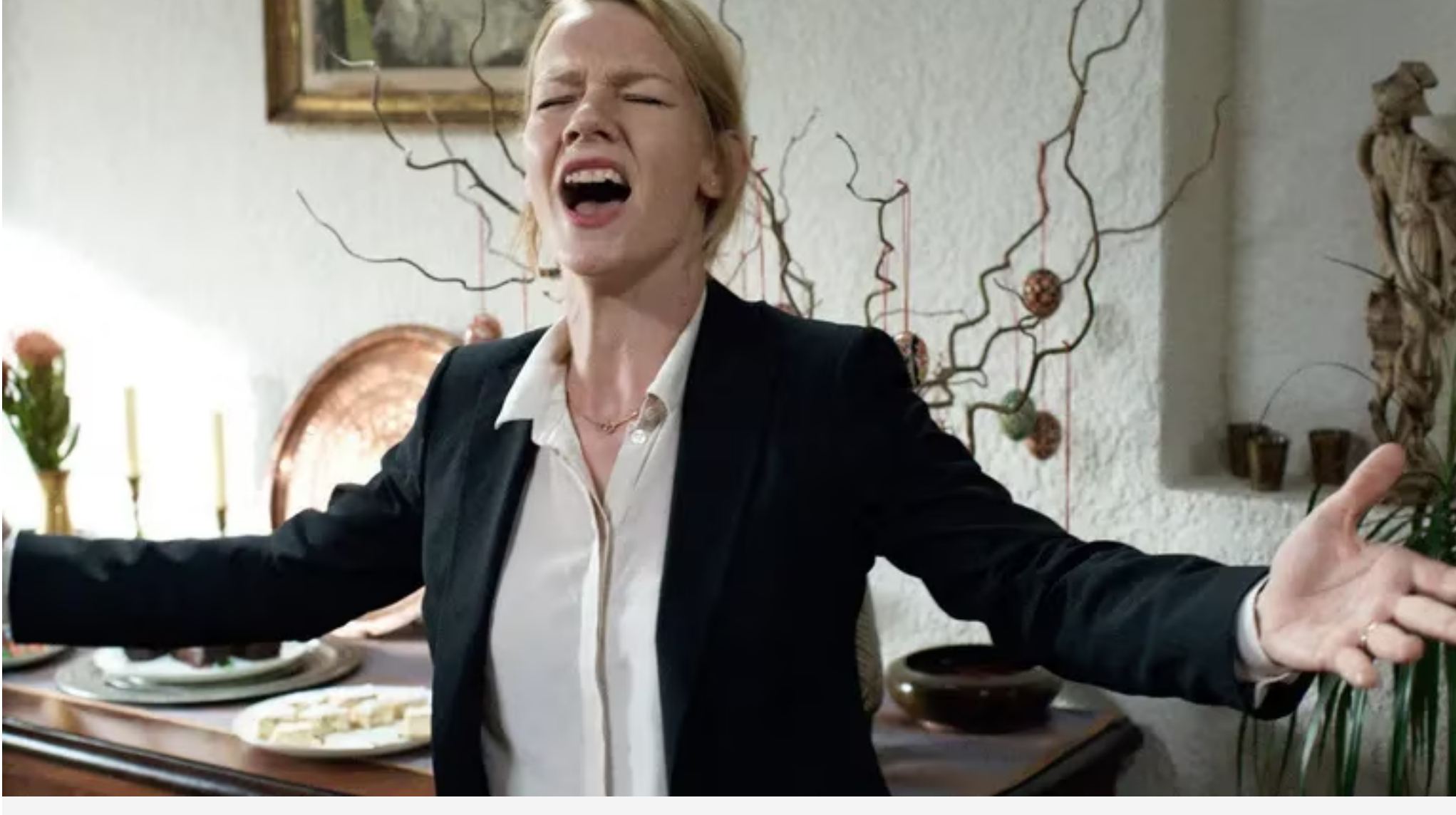
La película "Toni Erdmann" (2016) se podrá ver este domingo en el marco de la "Semana Alemana".

POR ABC COLOR 03 DE OCTUBRE DE 2023. - 14:02