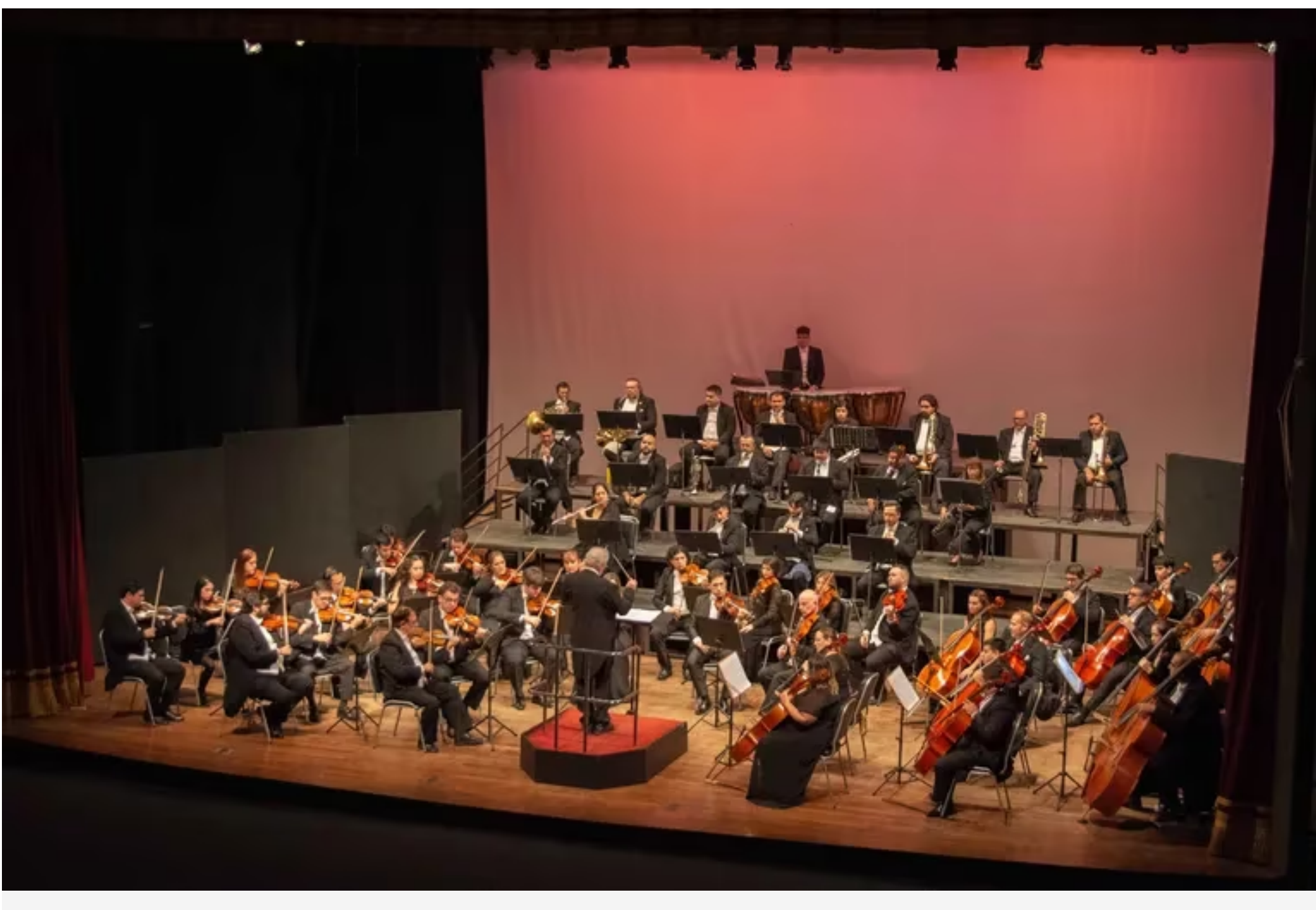
La OSCA presentará este jueves un concierto con obras de compositoras alemanas.

Este jueves 5, se realizará el 6° Concierto del Ciclo de Abono de la Orquesta Sinfónica de la Ciudad de Asunción (OSCA), en el Teatro Municipal “Ignacio A. Pane” (Pdte. Franco y Chile). El programa presentará en carácter de primera audición obras de las compositoras alemanas Fany Hensel, Emilie Mayer y Clara Wieck .