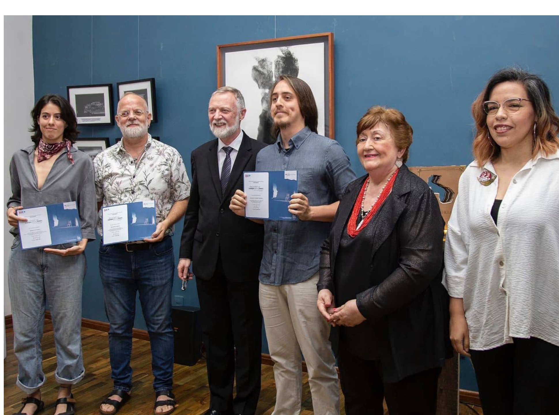
El ganador y dos mencionados de honor con el embajador de Alemania y las representantes del Museo de las Memorias y del ICPA-GZ.