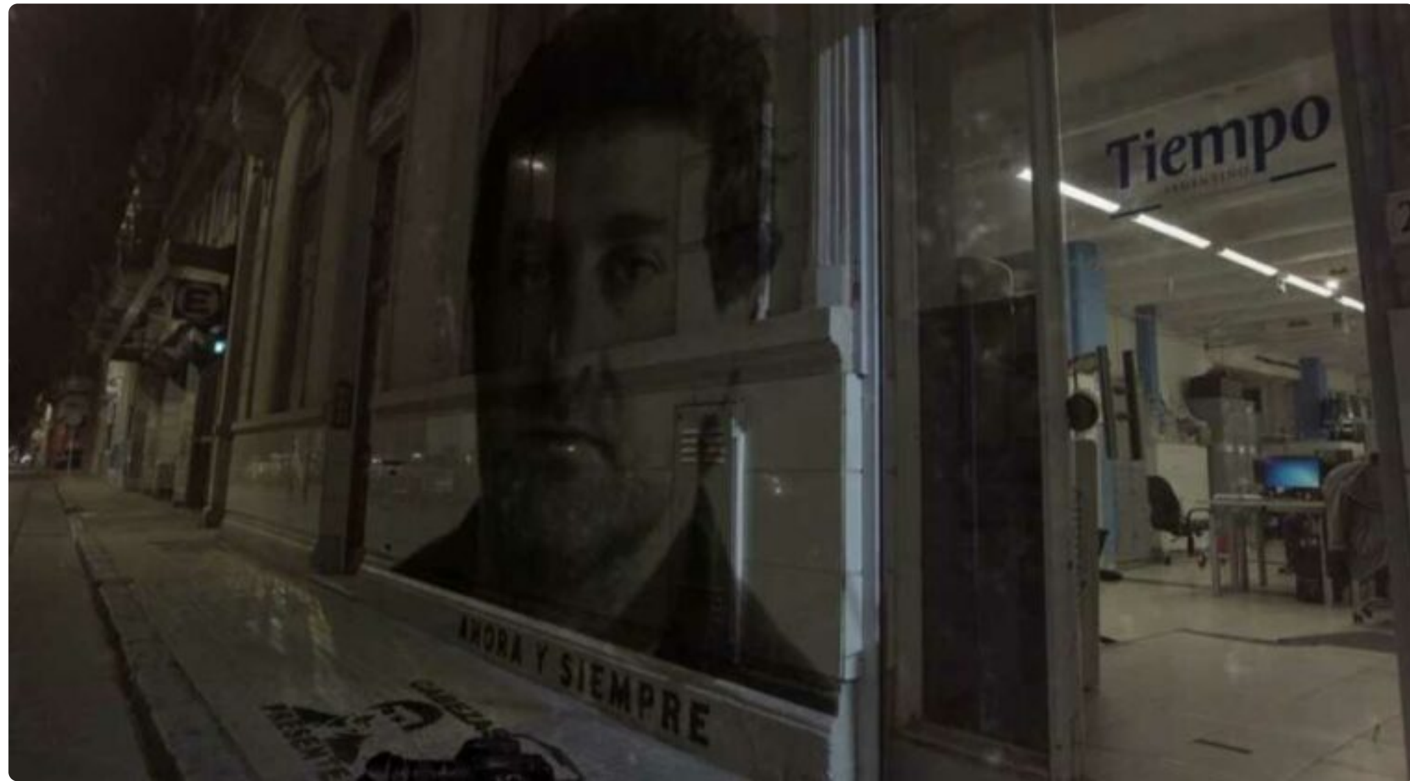
FOTO 1 DE 1 El documental "De la resistencia a la existencia", se proyectará en Asunción y Ciudad del Este.

Proyección en Paraguay del documental argentino "De la resistencia a la existencia"