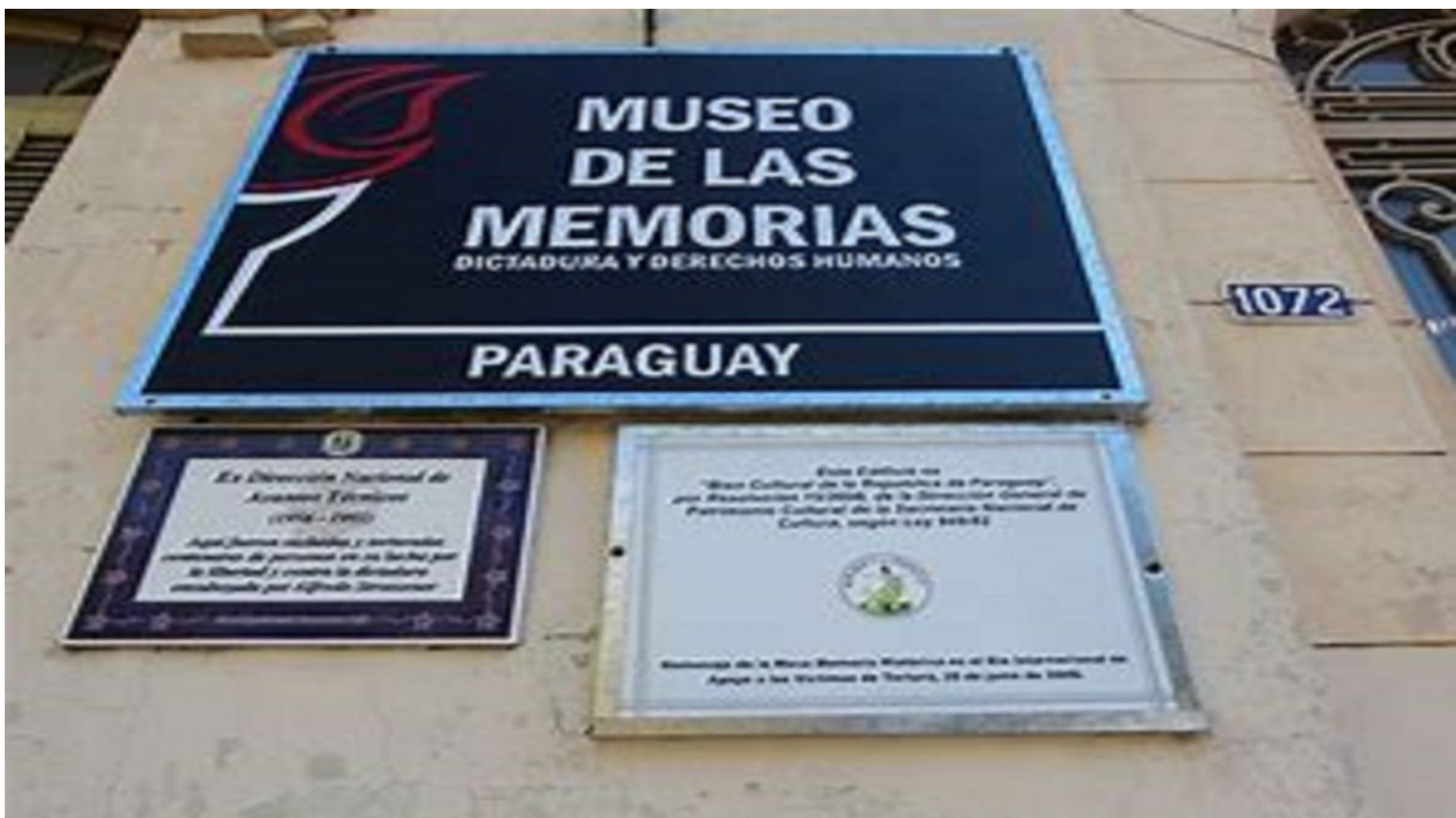
El certamen se realiza este año en colaboración con el Museo de las Memorias.

Hasta el 21 de septiembre está abierta la convocatoria del Premio de Artes Visuales organizado por la Embajada de Alemania y el Instituto Cultural Paraguayo-Alemán. Este año se realiza bajo el lema “Recordar es trabajar por el futuro” y en colaboración con el Museo de las Memorias: Dictadura y Derechos Humanos.