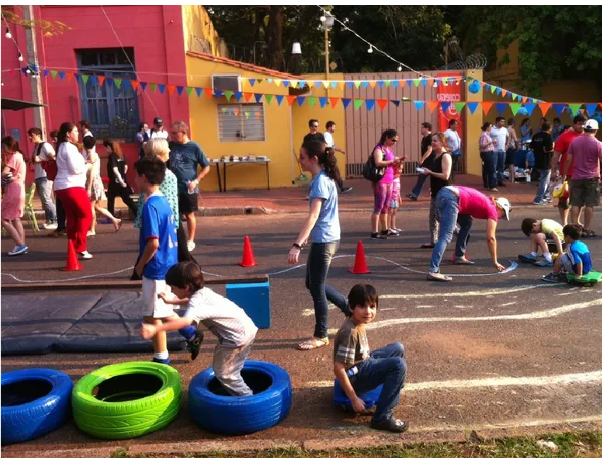
Callecultura ofrecerá juegos, talleres y otras actividades sobre la calle Juan de Salazar. gentile

Callecultura apunta a ofrecer a la ciudadanía una tarde diferente, con una variada agenda de actividades para grandes y chicos. De 16:00 a 20:00, la calle Juan de Salazar entre la avenida Artigas y San José se cerrará al tránsito vehicular para dar paso a juegos, talleres, espectáculos y ferias gastronómicas.