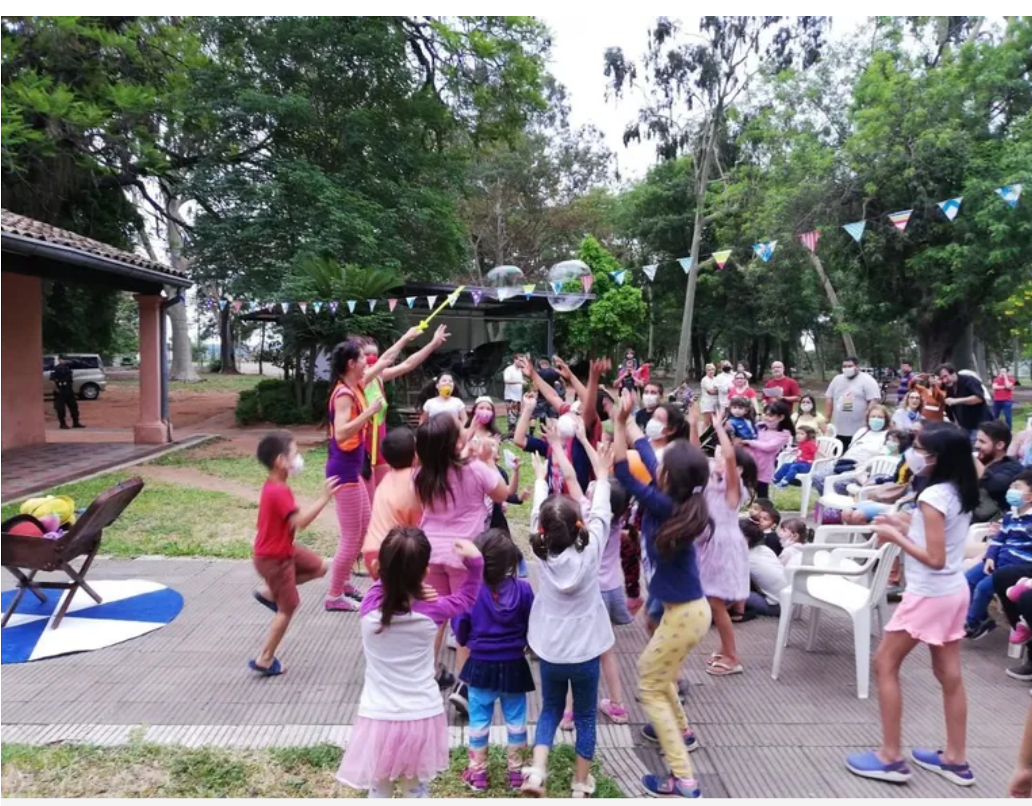
"Arte al Parque" apunta con distintas actividades artísticas y recreativas a la revitalización del Parque Caballero.

Este sábado también se llevará a cabo una nueva edición de Arte al Parque , en el marco de la reactivación del Parque Caballero . De 9:00 a 17:00 se tendrán visitas guiadas al Museo Bernardino Caballero, ubicado al interior del parque.