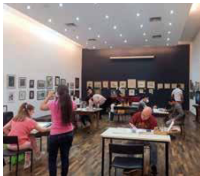
Foto: Workshop im ICPA