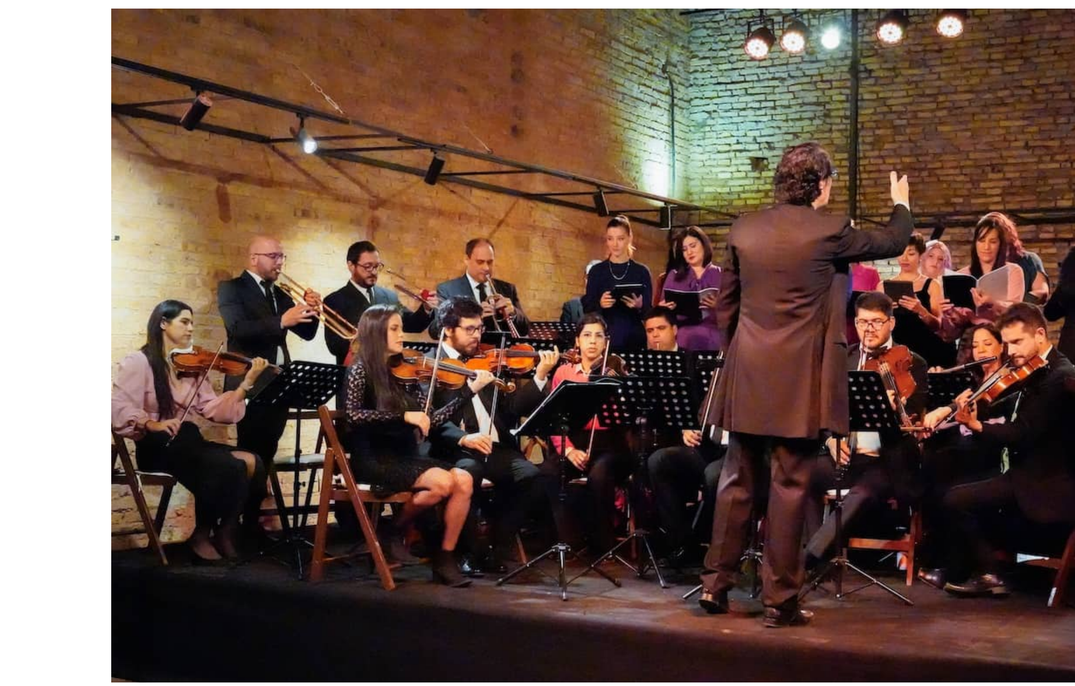
Festival Bach Sudamericano 2023.