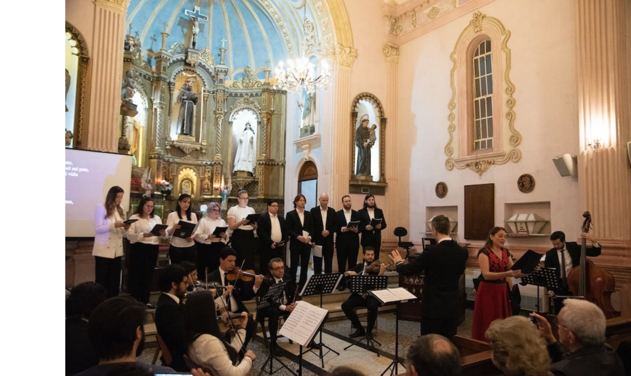
Festival Bach Sudamericano 2023.