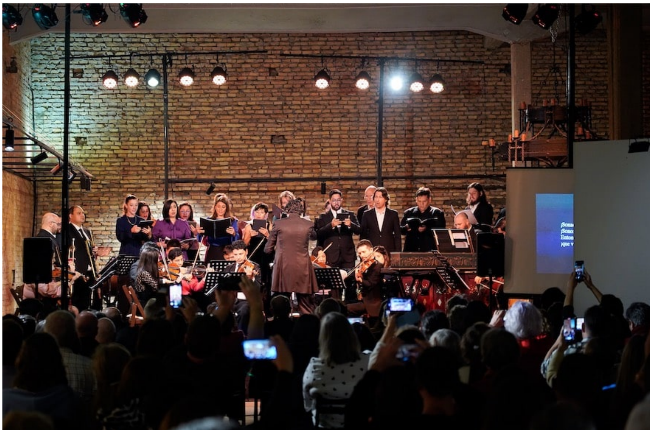
Festival Bach Sudamericano 2023.

El Festival Bach Sudamericano Asunción 2023, organizado por la Sociedad Bach del Paraguay en colaboración con el Circuito Bach Sudamericano, finaliza este domingo 23 de julio con un concierto que se llevará a cabo a las 19:00 horas en la Congregación Evangélica Alemana (Romero Pereira c/ Avda. España), con acceso libre y gratuito.