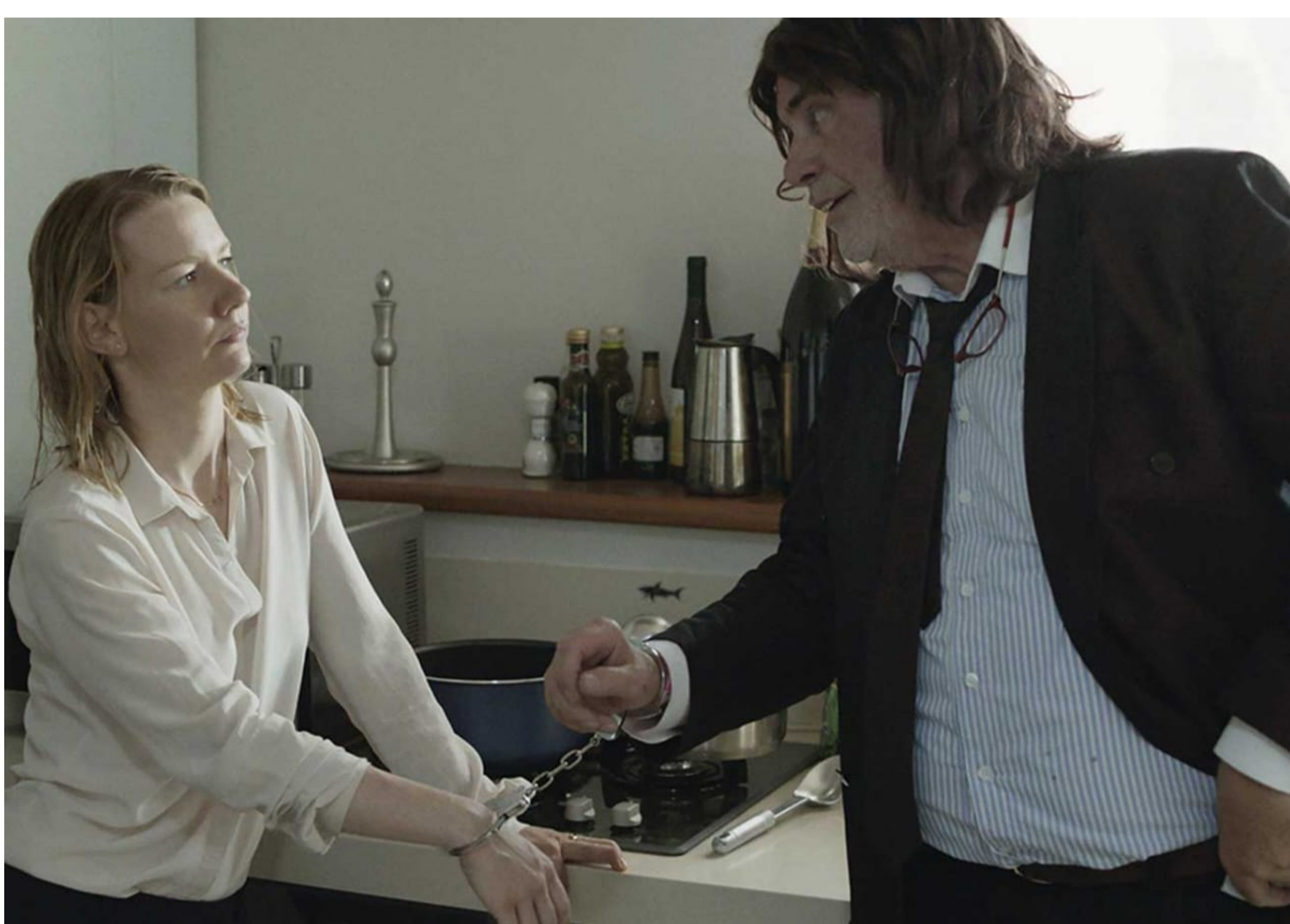
Escena de "Toni Erdmann".

El Instituto Cultural Paraguayo Alemán, con apoyo del Goethe Institut, invita a todo el público interesado al ciclo de cine retrospectivo de la directora Maren Ade, que tendrá lugar los jueves 29 de junio, y el 6 y 13 de julio. Las proyecciones tendrán lugar en el ICPA GZ (Juan de Salazar 310 c/ Artigas), a las 19:00 horas. La entrada es libre y gratuita.