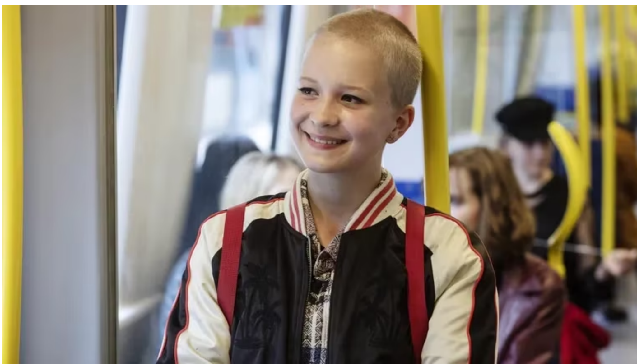
La película sueca “Pequeña Reina”, de Sanna Lenken, abrirá el ciclo este jueves 18.

POR ABC COLOR 17 DE MAYO DE 2023, - 01:00