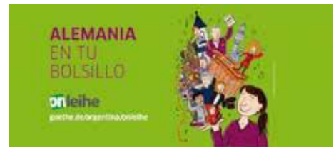
Text und Fotos: Simone Herdrich

auch digitale Filmreihen an. Die Streaming-Plattform und weitere Informationen finden Sie unter: https://protagonistinnen.goethe-on-demand.de/about-us .