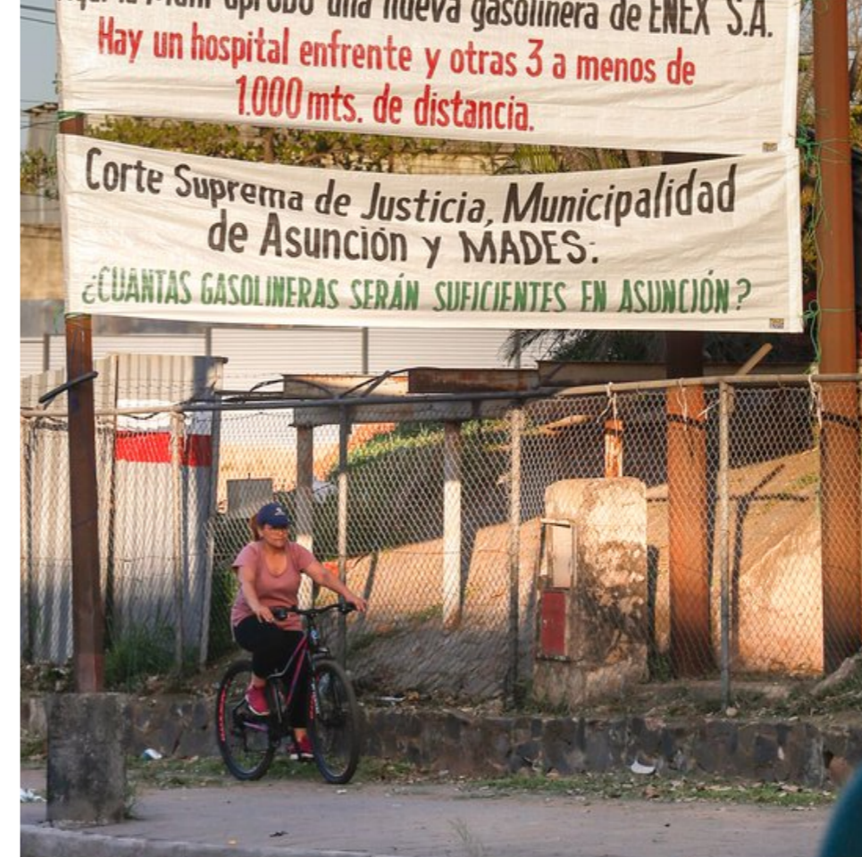
Pasacalles denunciando los sitios donde la Municipalidad de Asunción habilitó la construcción de nuevas estaciones de combustible