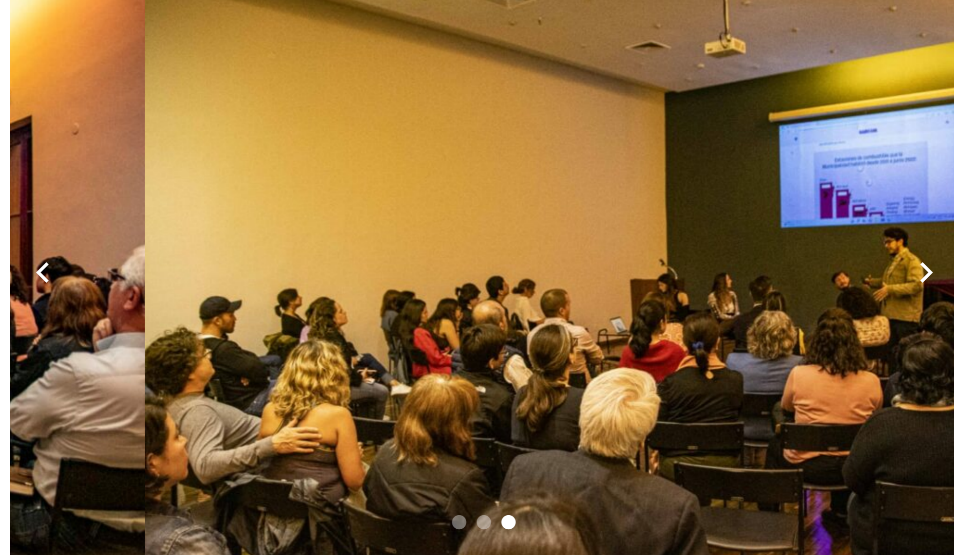
Presentación de hallazgos de investigación sobre estaciones de combustible en Asunción a la comunidad de El Surti – Fotografías: Cerardo Morínigo

Era septiembre de 2022 y hacía 3 días que publicamos una investigación que cruzó pedidos de información pública con licencias ambientales, datos catastrales, entrevistas con vecinos y vecinas y visitas a cada sitio de instalación de las estaciones de combustible para demostrar cómo la Municipalidad había aprobado de forma sistemática su construcción sin respetar distancias mínimas dispuestas . Esas distancias mínimas se habían establecido para proteger el agua del cual se abastecen tres millones de personas en Paraguay. Y también servían para proteger a la ciudad de la contaminación en el aire y reducir el peligro de incendios en los barrios. Pero la Municipalidad aprobó tantas estaciones – un promedio de dos por mes – que hoy la capital tiene más sitios para cargar gasolina que plazas.