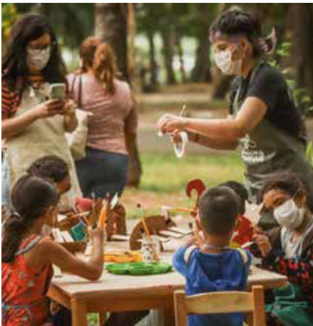
Foto: Bastelaktion im Parque Bernardino Caballero

Mit großem Erfolg wurde das Projekt Arte al Parque (Kunst im Park) auch im Januar weiter durchgeführt. Im historischen Parque Bernardino Caballero in der unmittelbaren Nähe des ICPA fanden jeden Samstag zahlreiche kulturelle Angebote wie Bastelgruppen, Theater, Sportveranstaltungen und Konzerte für Kinder und junge Erwachsene statt.