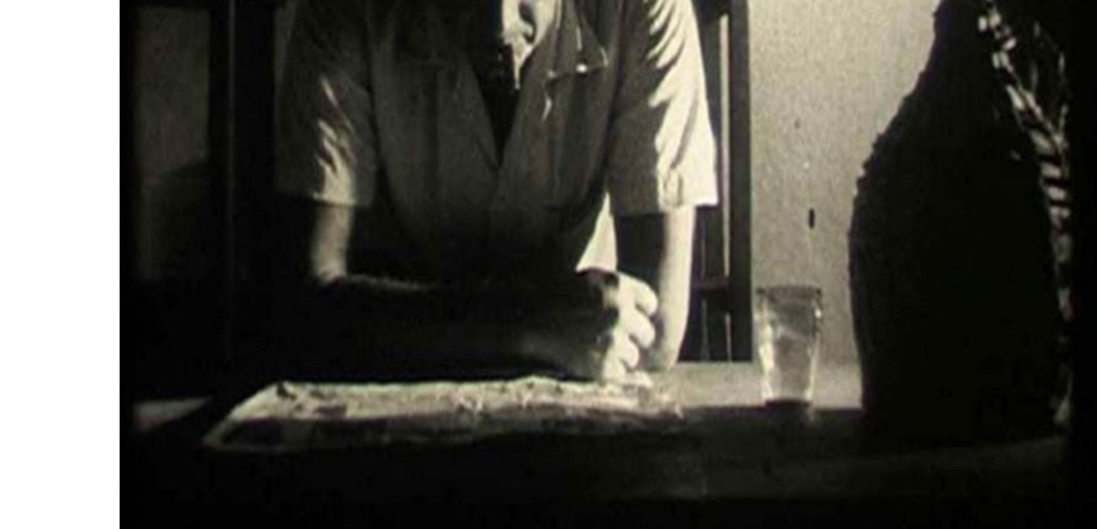
Fotograma de El pueblo (1969), filme proyectado en el festival ULTRAcinema . Cortesía

También en el Juan de Salazar se desarrolló ULTRAcinema , festival de cine experimental que tuvo su primera edición en el mes de octubre. Surgido en Ciudad de México hace más de una década, hoy el festival se extiende a más de 10 países bajo la dirección de Michael Ramos Araizaga. El programa en Asunción incluyó proyecciones de obras internacionales, un día dedicado especialmente a audiovisuales de creadores de la región seleccionados por convocatoria abierta, experimentaciones in vivo entre México y Paraguay, talleres de cine y mesas redondas.