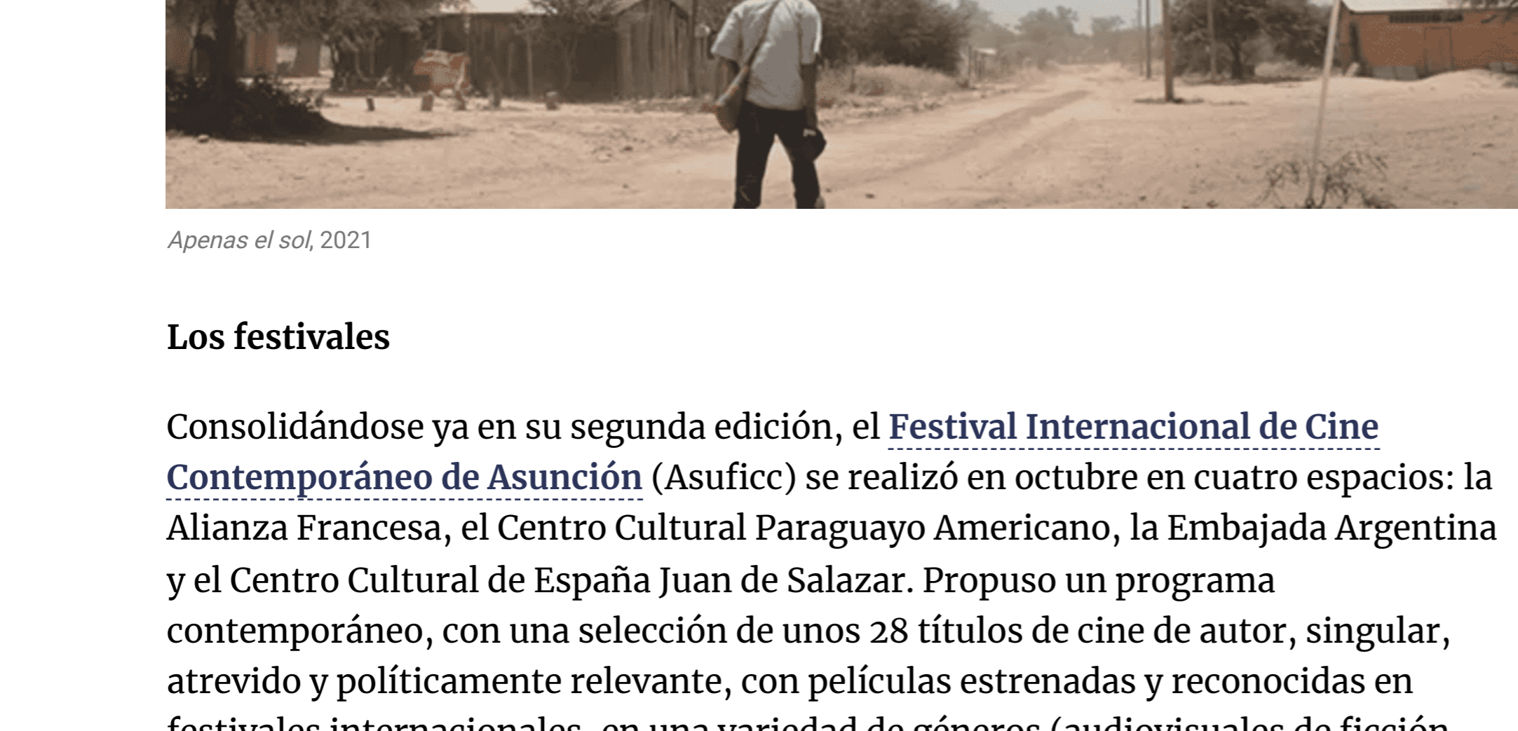
Apenas el sol, 2021

Paralelamente al circuito comercial, cuya estrella fue, sin lugar a duda, Argentina 1985 , de Santiago Mitre, hubo cine en diversos centros culturales de Asunción que ofrecieron ciclos sostenidos a lo largo del año, acompañados de charlas y debates. Asimismo, variados festivales hicieron su gran aporte a la escena, en tanto Apenas el sol , de Aramí Ullón, y Eami , de Paz Encina, dos filmes que cosecharon premios y reconocimientos internacionales, pudieron ser vistos en todos los cines.