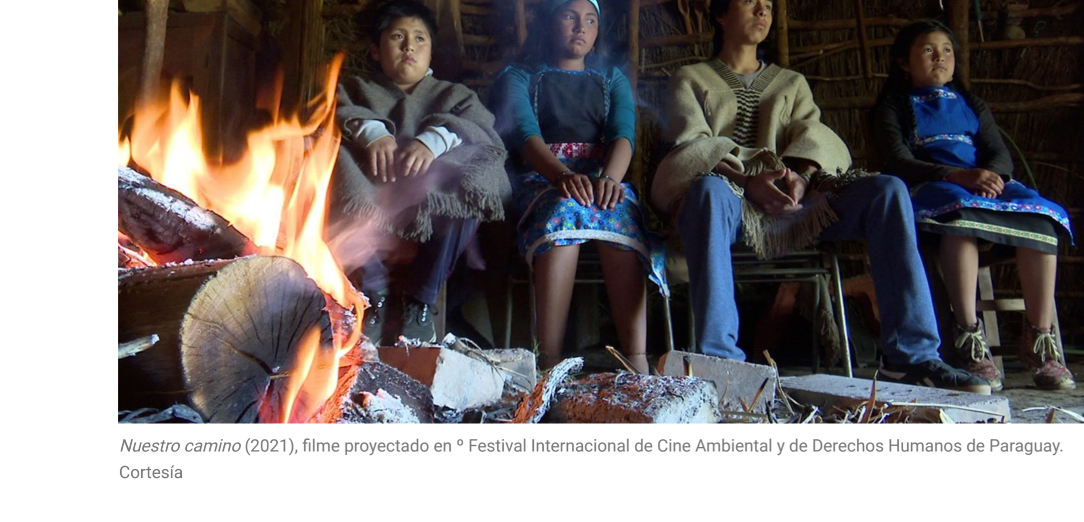
Nuestro camino (2021), filme proyectado en 6º Festival Internacional de Cine Ambiental y de Derechos Humanos de Paraguay.

Por su parte, en octubre, la Alianza Francesa fue sede del 6.º Festival Internacional de Cine Ambiental y de Derechos Humanos de Paraguay (Fincadh), que propuso 15 obras audiovisuales de Canadá, Europa, Argentina, Paraguay, entre otros, las cuales giraron en torno a la biodiversidad, la cultura indígena y la comunidad LGBTQI+.