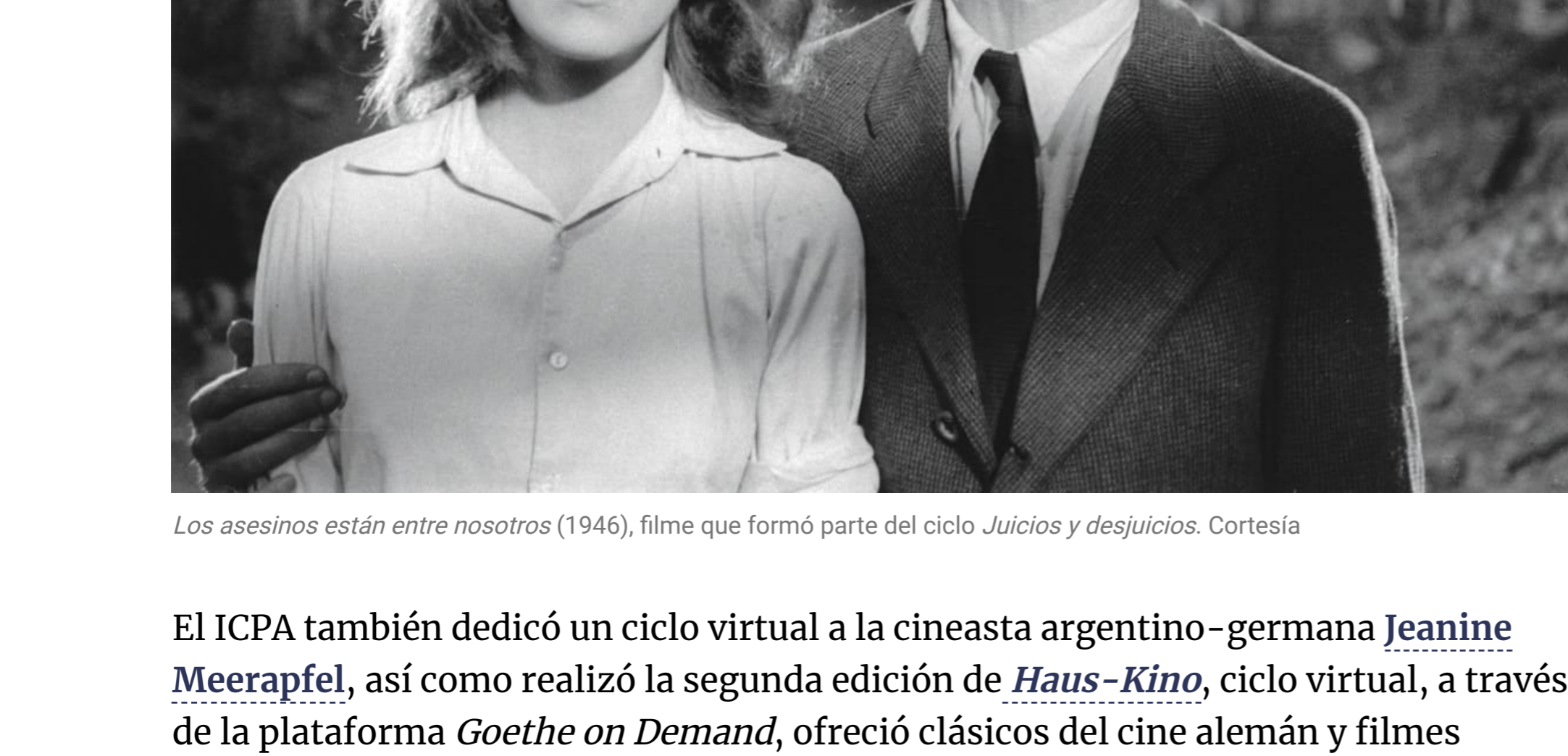
Los asesinos están entre nosotros (1946), filme que formó parte del ciclo Juicios y desjuicios .

Uno de los centros culturales que se constituyó en referencia de buen cine fue el Instituto Cultural Paraguayo-Alemán (ICPA), que desarrolló a lo largo del año ciclos dedicados al cine alemán, tanto presenciales como virtuales. Algunos de los ciclos fueron Juicios y desjuicios , Material, Ecología, naturaleza y otras faunas , y Patria o exilio , la mayoría dedicados a temáticas ecológicas, la historia, la memoria y los cambios políticos y culturales vividos en Alemania durante el siglo XX.