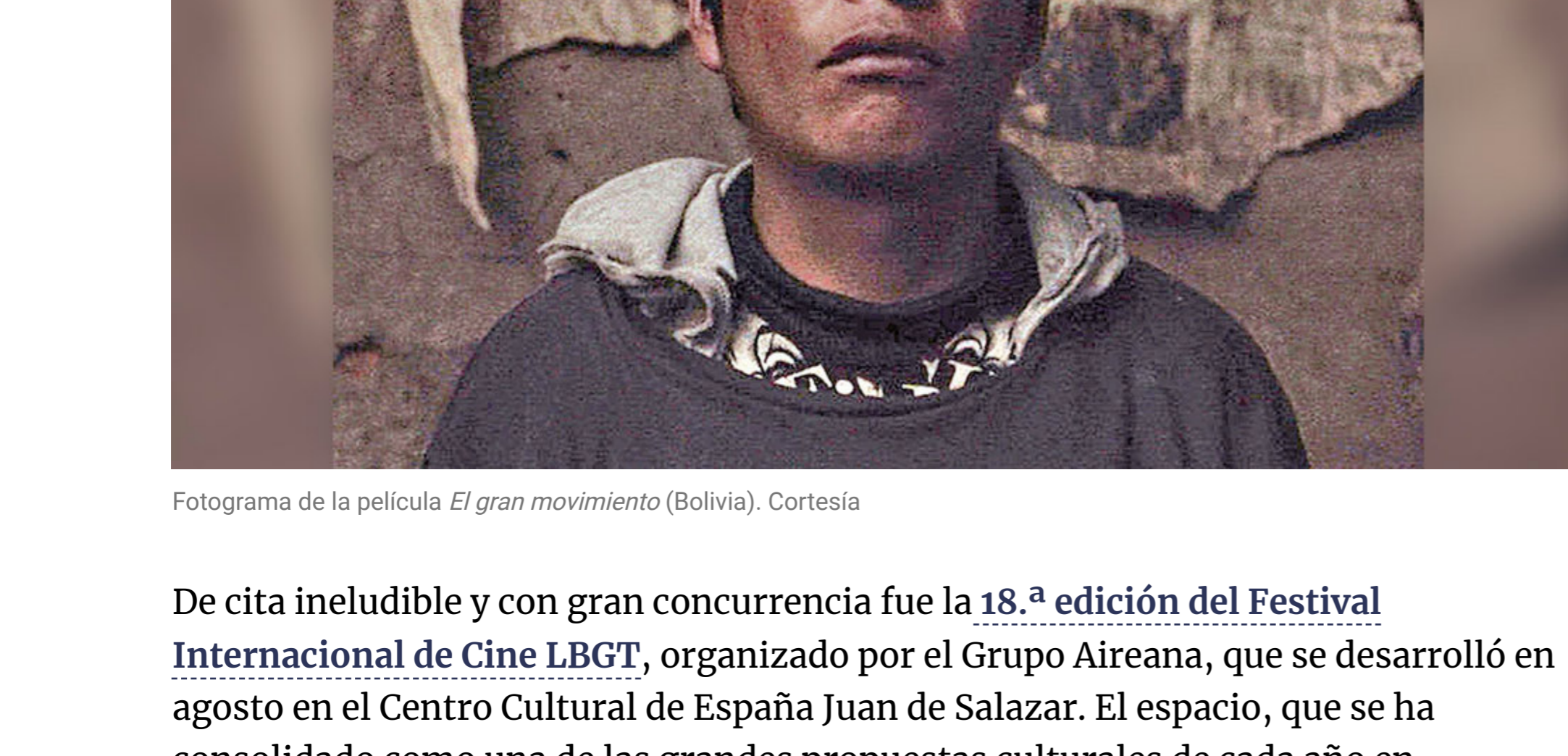
Fotograma de la película El gran movimiento (Bolivia).

Consolidándose ya en su segunda edición, el Festival Internacional de Cine Contemporáneo de Asunción (Asufic) se realizó en octubre en cuatro espacios: la Alianza Francesa, el Centro Cultural Paraguayo Americano, la Embajada Argentina y el Centro Cultural de España Juan de Salazar. Propuso un programa contemporáneo, con una selección de unos 28 títulos de cine de autor, singular, atrevido y políticamente relevante, con películas estrenadas y reconocidas en festivales internacionales, en una variedad de géneros (audiovisuales de ficción, documental y animación). Tuvo gran concurrencia el filme de apertura, El gran movimiento , del director boliviano Kiro Russo. En las competencias internacionales de largometrajes y cortos fueron premiados Mostró , de José Pablo Escamilla (México, 2021), y Bestia , de Hugo Covarrubias (Chile, 2021). Asimismo, concitaron gran interés las dos secciones paralelas: Panorama paraguayo , dedicada al cine nacional, y Antes Muerto Cine , que presentó filmes del colectivo homónimo con base en Buenos Aires.