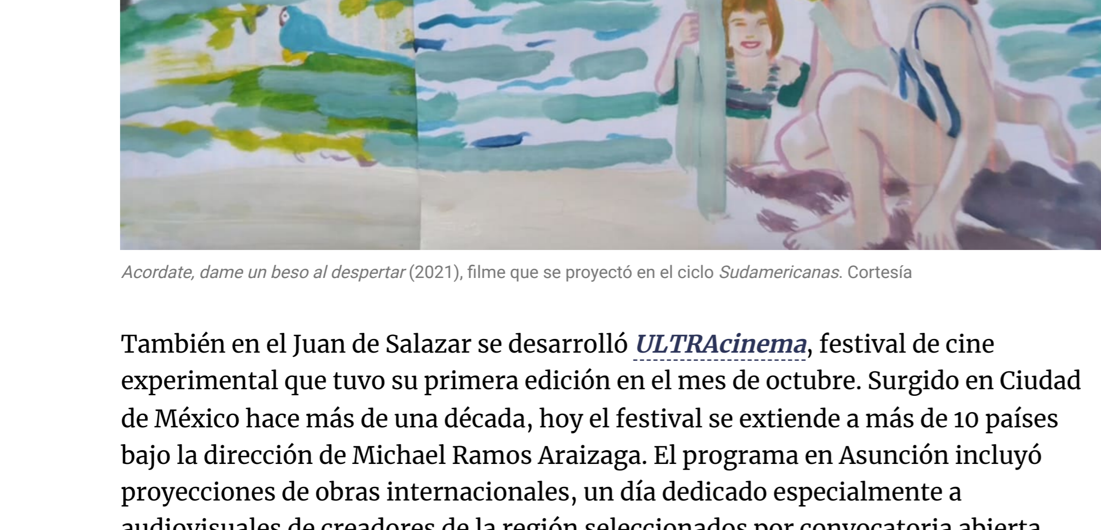
Acordate, dame un beso al despertar (2021), filme que se proyectó en el ciclo Sudamericanas.