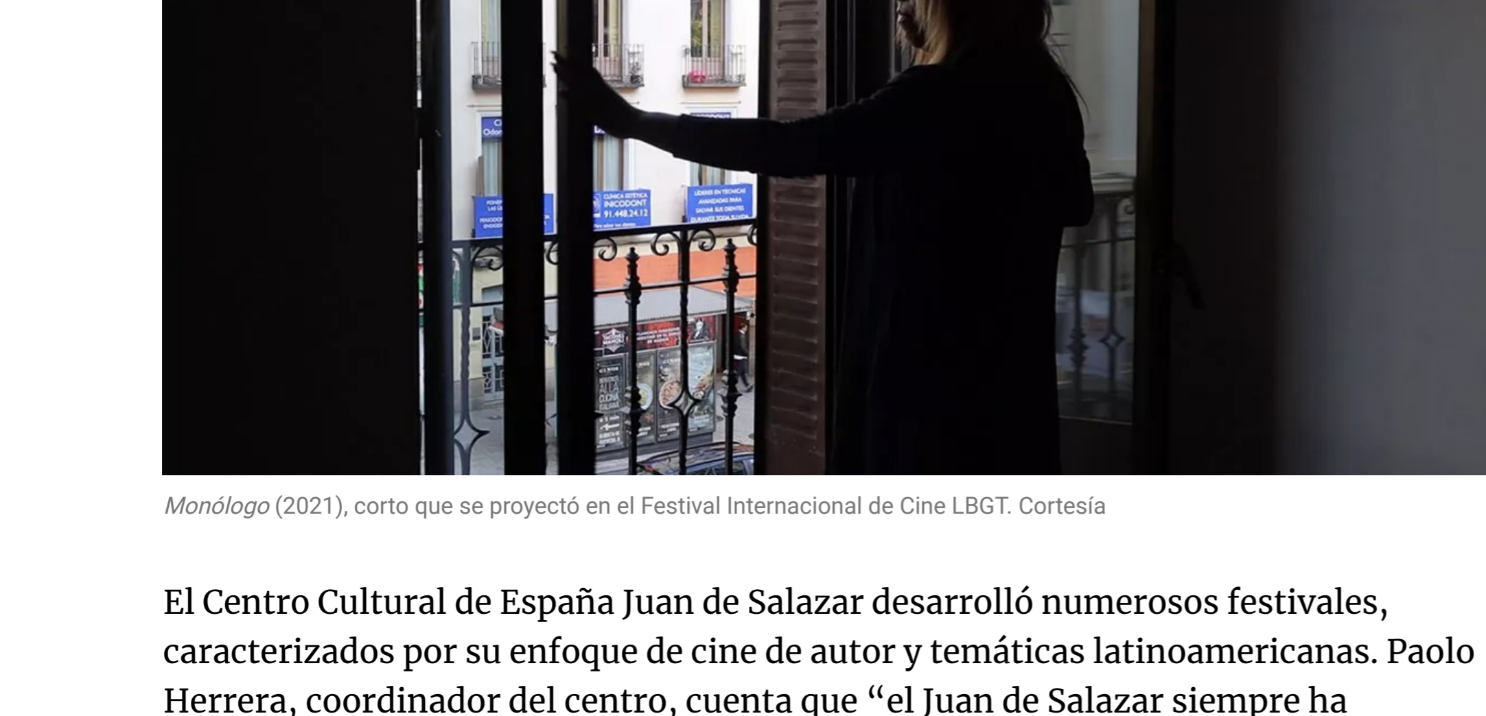
Monólogo (2021), corto que se proyectó en el Festival Internacional de Cine LGBT.

De cita ineludible y con gran concurrencia fue la 18.ª edición del Festival Internacional de Cine LGBT , organizado por el Grupo Aireana, que se desarrolló en agosto en el Centro Cultural de España Juan de Salazar. El espacio, que se ha consolidado como una de las grandes propuestas culturales de cada año en Asunción, presentó este año largometrajes, documentales y cortos de Alemania, Argentina, Austria, Brasil, Chile, Colombia, Cuba, Estados Unidos, España, Francia, India, Islas Vírgenes, Japón, México, Paraguay, Perú, Reino Unido, Sudáfrica, Suecia, Uruguay.