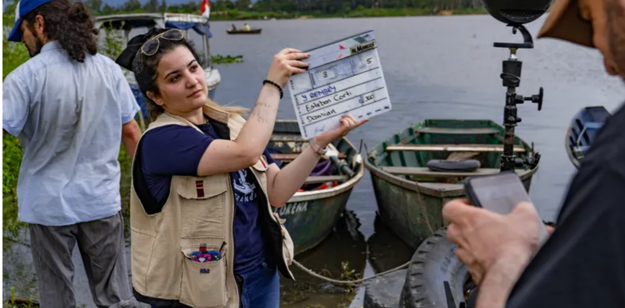
Proyectos audiovisuales en realidad aumentada son los que buscaba el EXPYLAB para su desarrollo.

En ese sentido se convocó a creadores que presenten sus proyectos en etapa de idea y/o desarrollo. Fueron proyectos narrativos, de ficción o no ficción, de video 360º, realidad virtual y animación, como también de experiencia sonora binaural, de realidad aumentada y otros tipos de formato inmersivo.