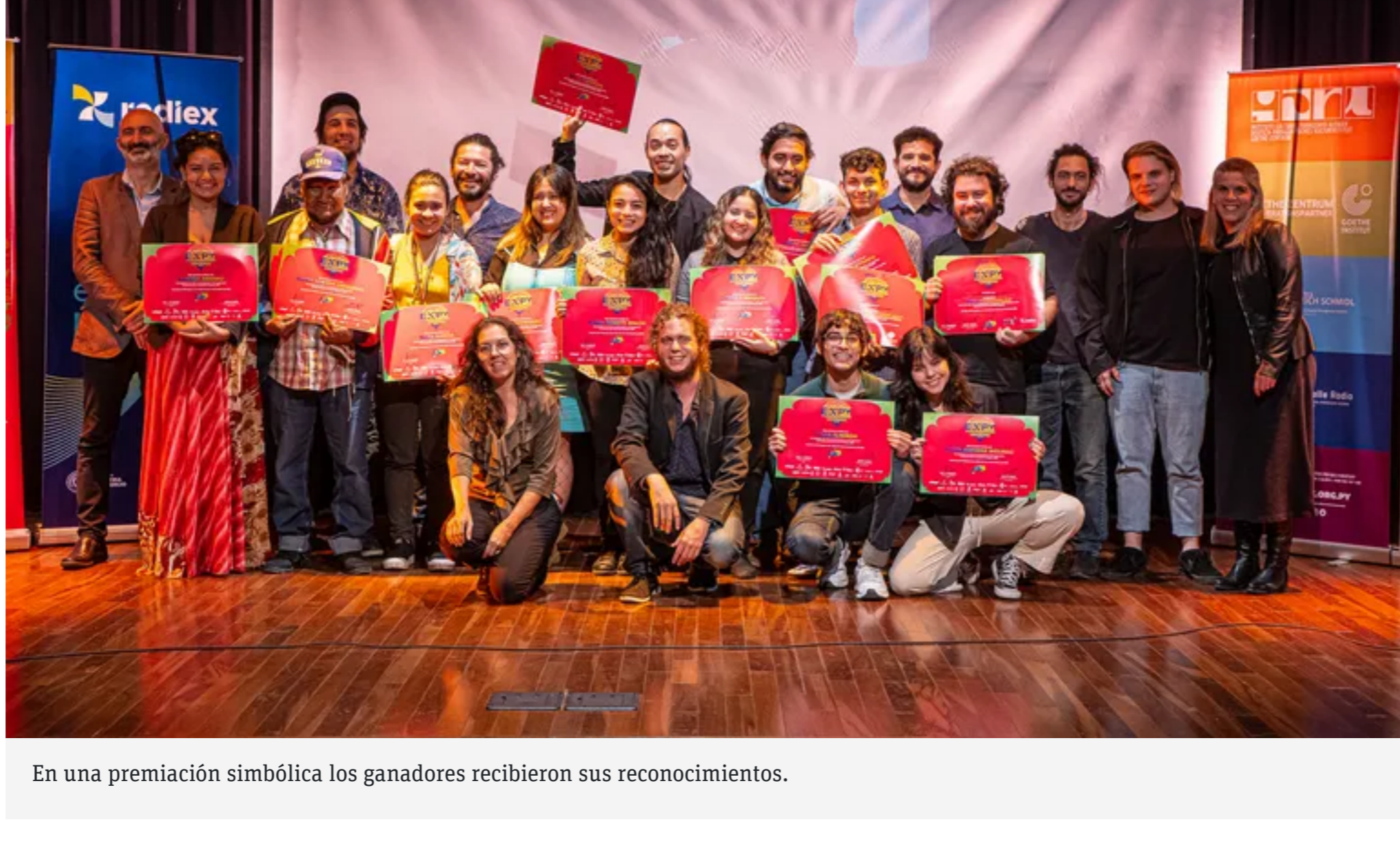
En una premiación simbólica los ganadores recibieron sus reconocimientos.

POR ABC COLOR 09 DE DICIEMBRE DE 2022 - 19:31