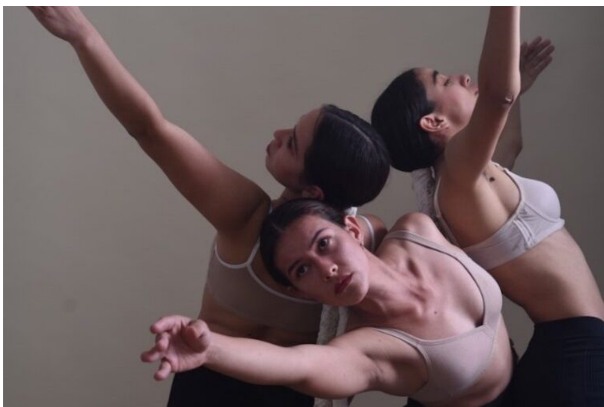
Parte del Elenco Alas Abiertas. Foto:

Sergio Núñez lleva la dirección general, el diseño de luces es de Martín Pizzichini, la fotografía, video y diseño de afiche es de Javier Valdéz, y el diseño de vestuario es de Macarena Candia.