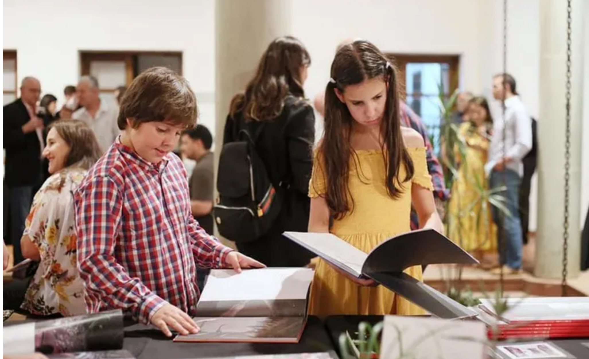
La Feria Internacional del Libro Fotográfico Autoral busca acercar el gusto por la fotografía a grandes y chicos.

POR ABC COLOR 04 DE NOVIEMBRE DE 2022. - 14:52