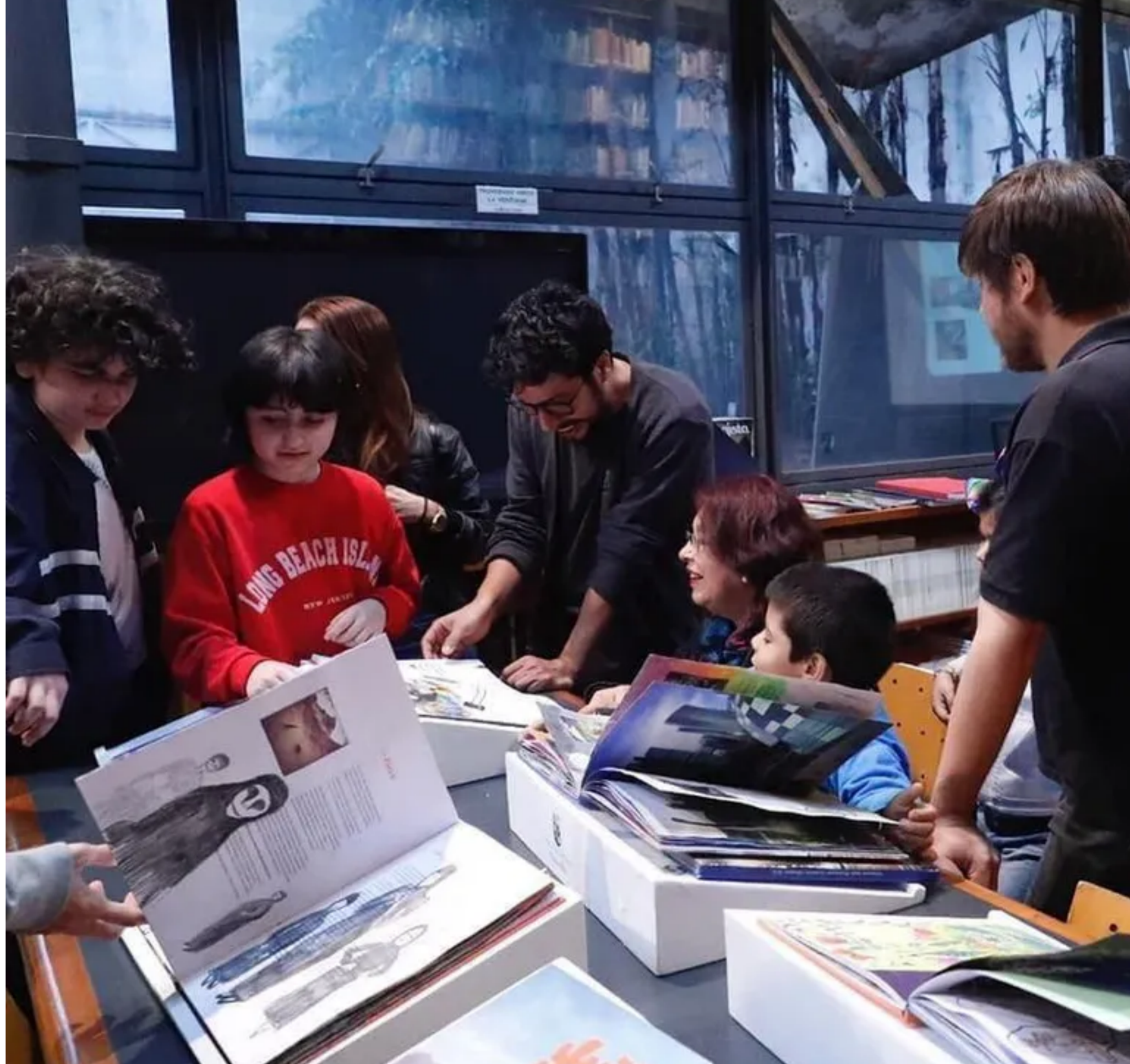
El Ojo Salvaje busca llegar con este tipo de actividades a la mayor cantidad de público posible.