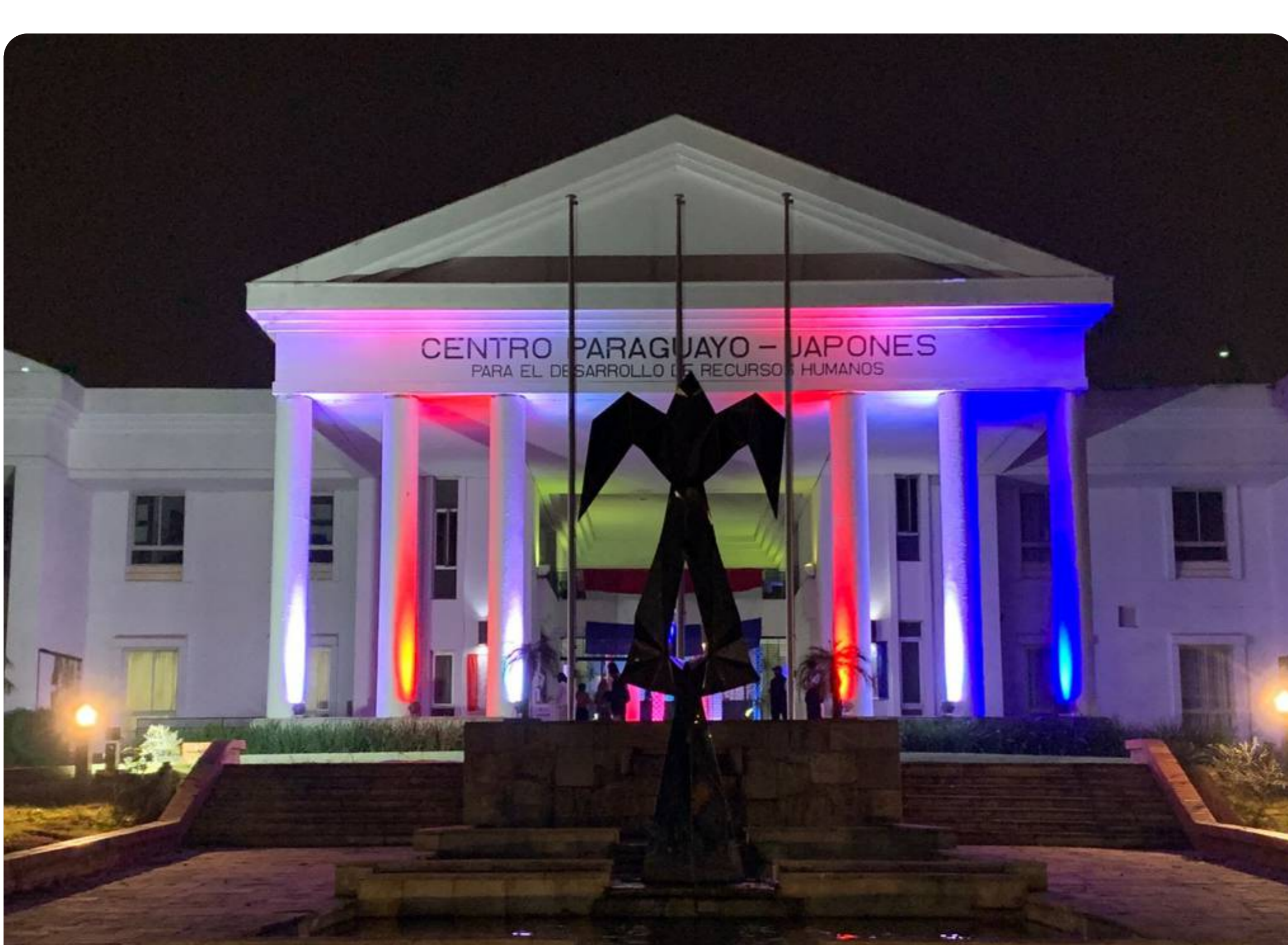
Se suma un nuevo aniversario del Centro Paraguayo Japonés.