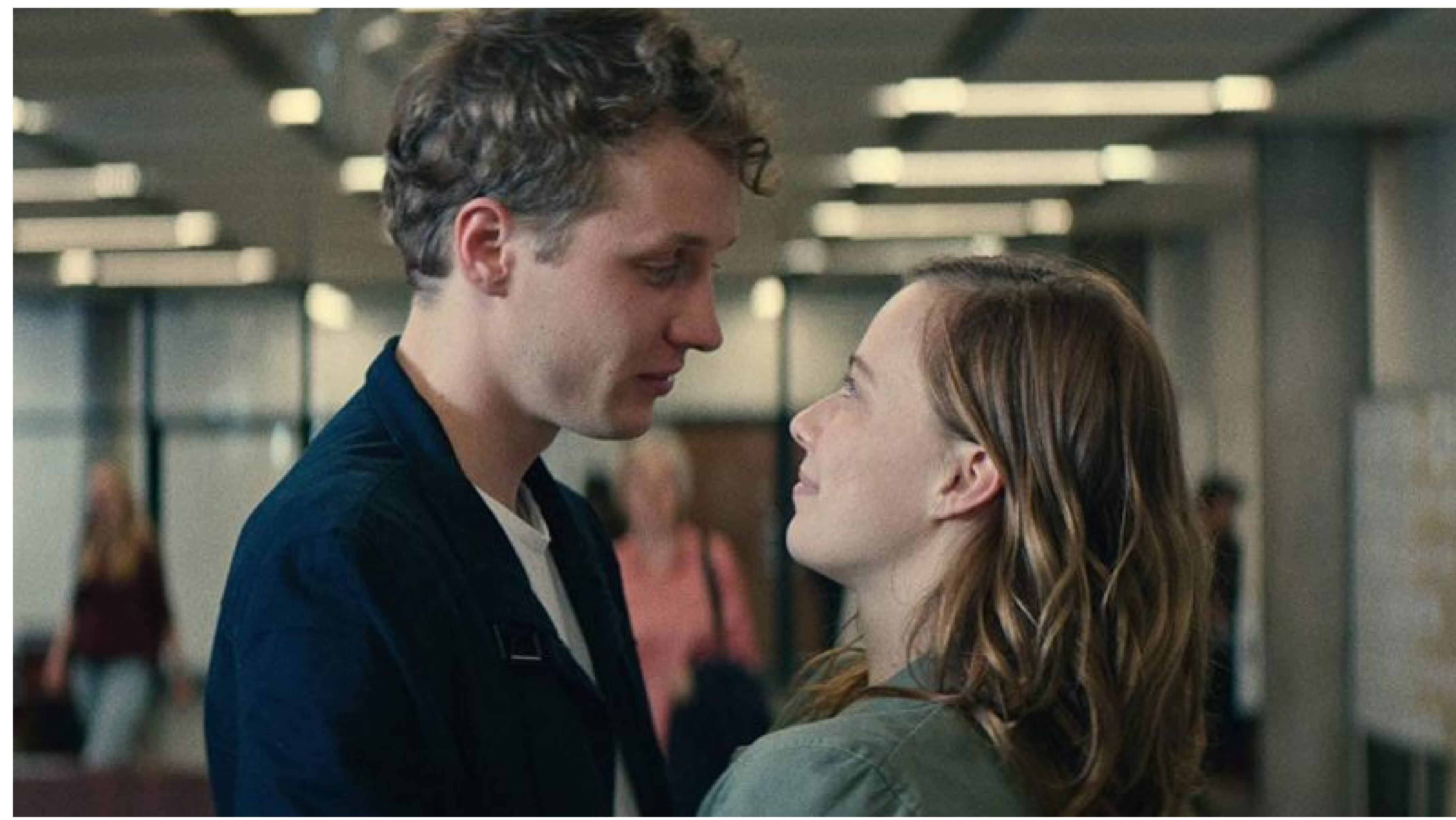
"Mi final. Tu Comienzo" (2019), de Mariko Minoguchi, uno de los filmes que podrán verse este año.