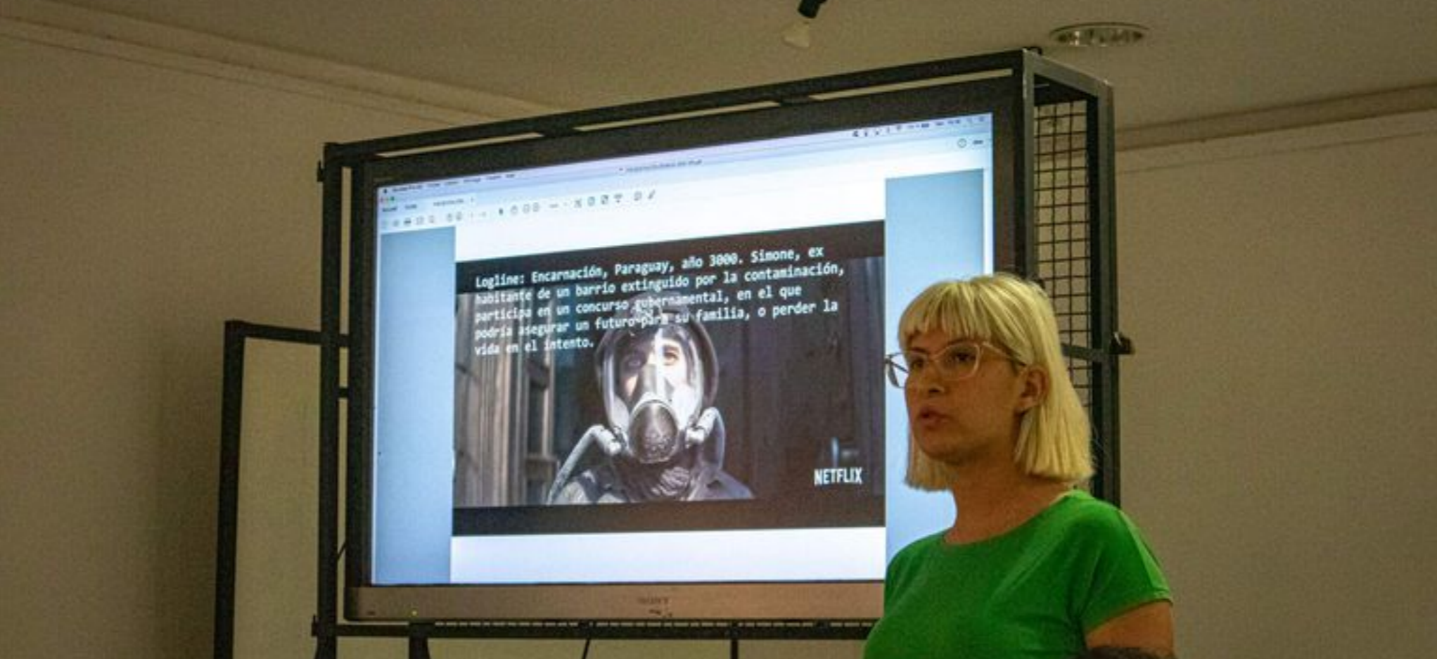
Los laboratorios sirven para el desarrollo del proyecto y para que cada participante pueda tener esta experiencia profesional.

“El objetivo es poder otorgar una oportunidad a talentos que quieran potenciar sus ideas, potenciar sus aptitudes artísticas y que tengan un espacio de trabajo en el cual se sientan cómodos para desarrollar sus proyectos y trabajar sus ideas”, resaltó el productor.