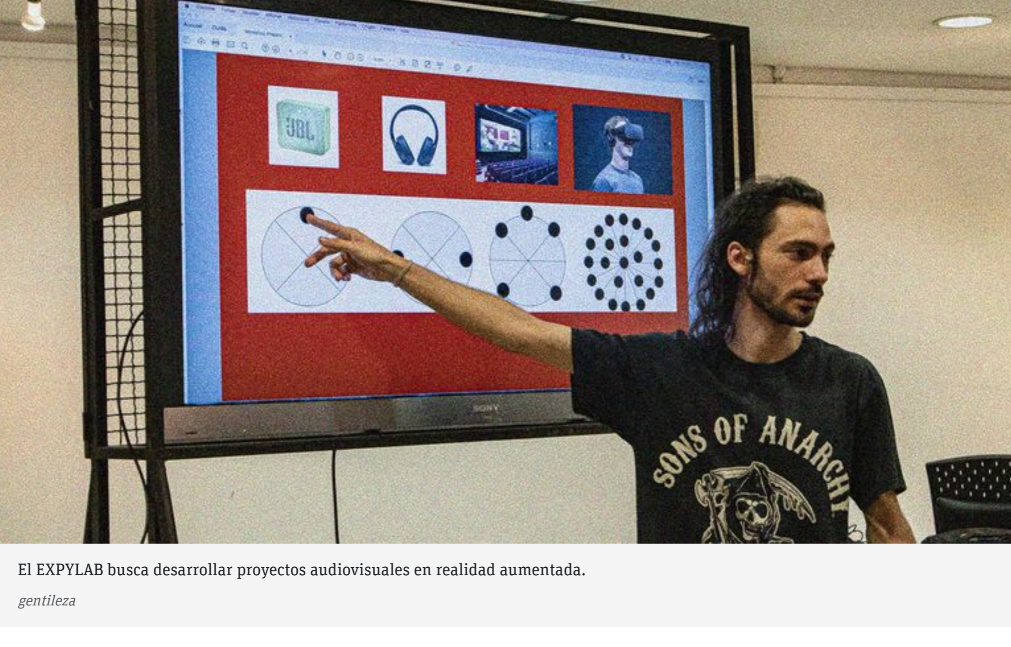
El EXPYLAB busca desarrollar proyectos audiovisuales en realidad aumentada.

POR MAVI MARTÍNEZ 16 DE SEPTIEMBRE DE 2022, - 01:00