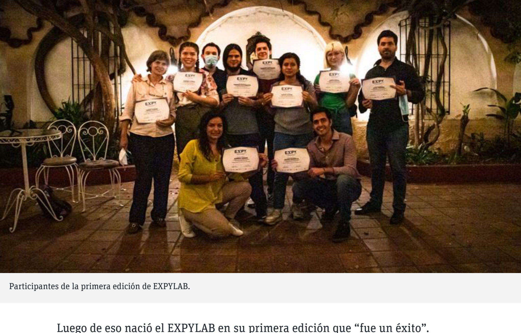
Participantes de la primera edición de EXPYLAB.

“Tras eso decidimos seguir desarrollando estas nuevas tecnologías y nuevas narrativas, porque tenemos que ser más creadores, más artistas, más quienes creemos con nuevas tecnologías, con realidad virtual, realidad aumentada, con todas las realidades extendidas”, consideró.