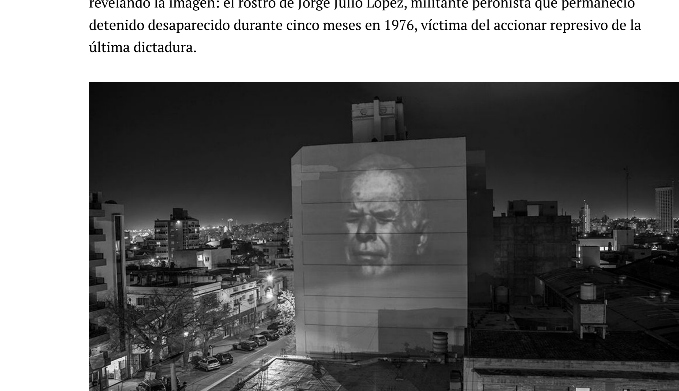
Proyección del rostro del desaparecido Julio López, en 2014.