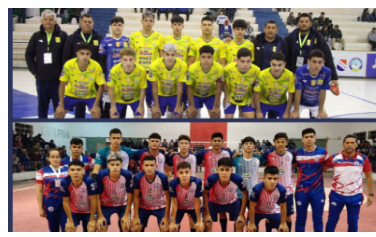
DEPORTES Presidente Franco y Vallemí disputarán la final del Nacional C17