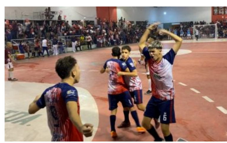
DEPORTES Apretadísima lucha en la clasificación del Nacional C17