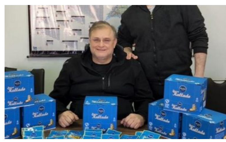
EMPRESARIADO Queso rallado de industria nacional gana espacio en el mercado