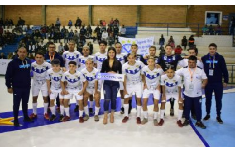
DEPORTES Resultados y goleadores de la primera fecha del Nacional C17