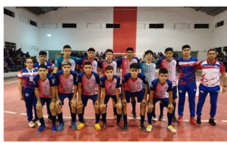
DEPORTES Así quedó la tabla después de la segunda fecha del Nacional C17