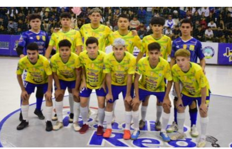
DEPORTES El Campeonato Nacional C17 ya tiene a sus semifinalistas