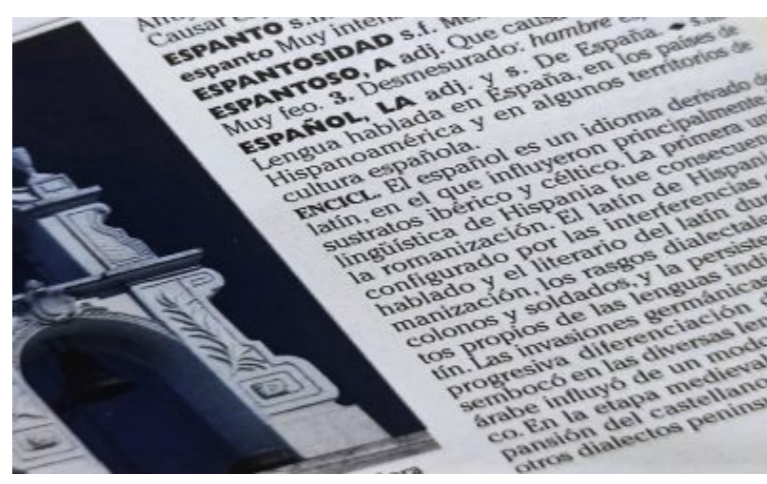
AGENDA CULTURAL Aparle aclara que no hay nuevos cambios en la lengua española