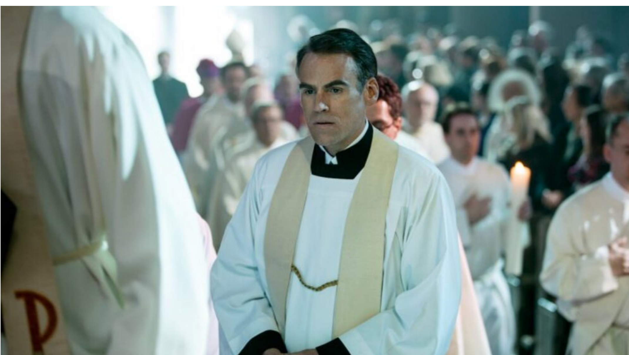
"Pecado", 2015. Cortesía

Este miércoles 31 de agosto continúa Juicios y desjuicios , ciclo de cine alemán organizado por el Instituto Cultural Paraguayo-Alemán, con entrada libre y gratuita. A las 19:00 horas se proyectará el filme Pecado (2015), de Gerd Schneider, en el centro cultural, ubicado en la calle Juan de Salazar 310 casi Artigas.