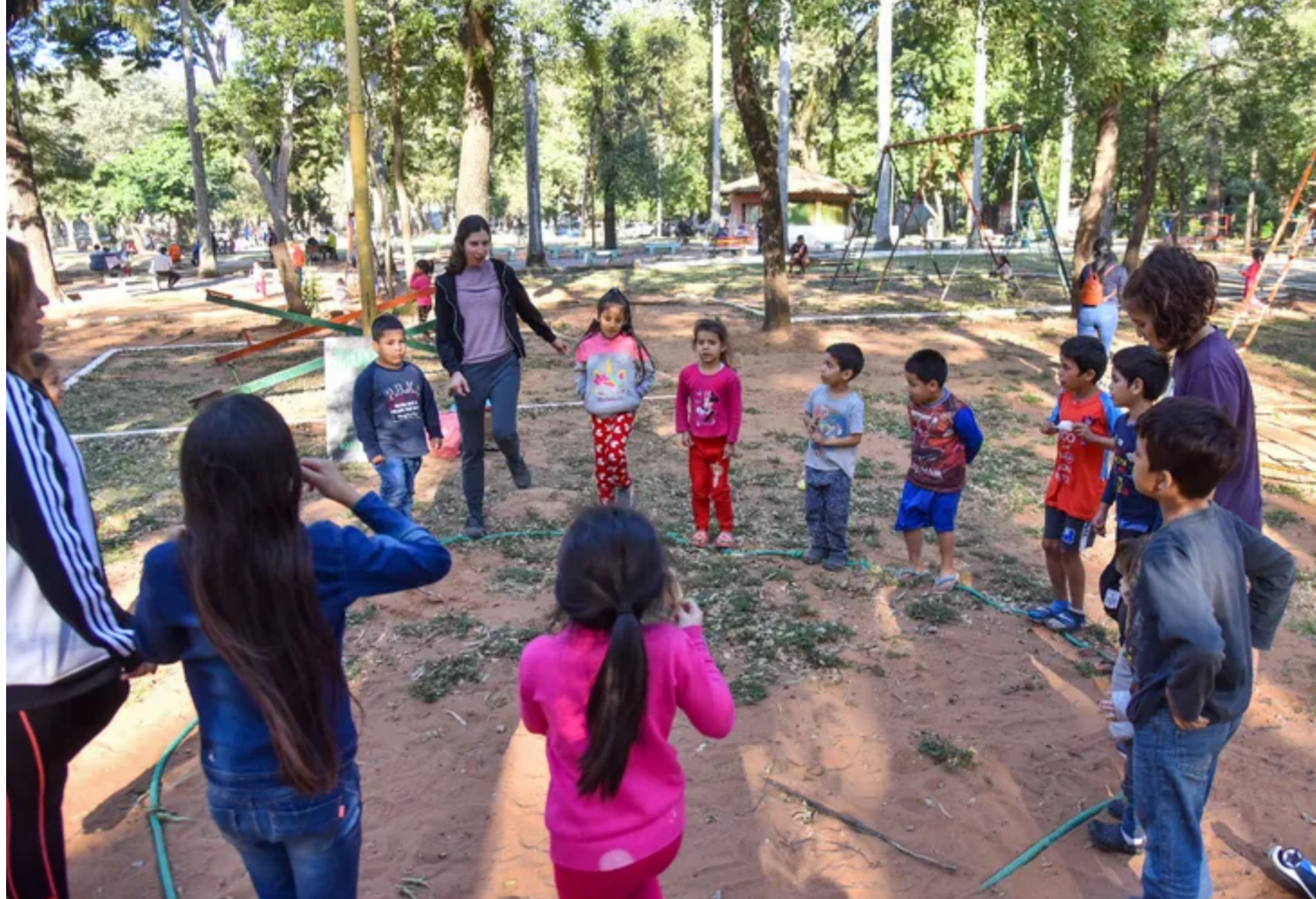
Los niños pueden aprovechar cada sábado de juegos, cuentacuentos, talleres, entre otras actividades sin costo alguno.

Asimismo, también se llevan a cabo cuentacuentos, talleres, obras de teatro y musicales, entre otros eventos, los cuales son completamente gratuitos para los participantes.