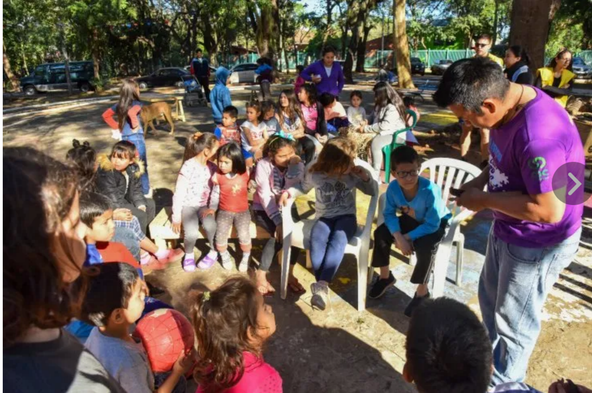
El Parque Caballero de Asunción se está erigiendo como un sitio de recreación y aprendizaje.

Una serie de actos culturales, deportivos, artísticos y de ocio para grandes y pequeños tienen lugar cada sábado, de 15:00 a 18:00, en el Parque Caballero de Asunción . Es una iniciativa que arrancó en noviembre del 2021, con la que se busca reactivar y mantener el lugar de esparcimiento.