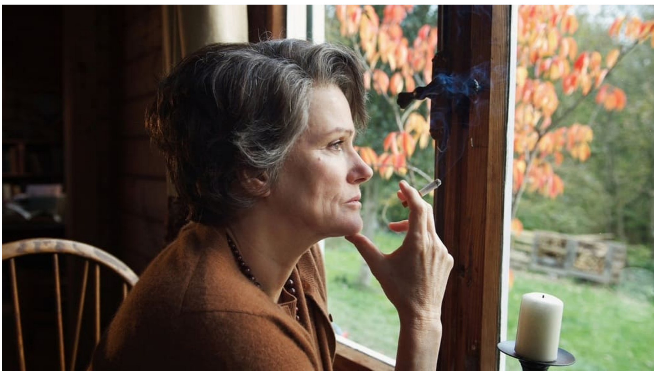
"Hannah Arendt", 2012.

Este miércoles 24 de agosto inicia Juicios y desjuicios , ciclo de cine alemán organizado por el Instituto Cultural Paraguayo-Alemán, con entrada libre y gratuita. A las 19:00 horas se proyectará el film Hannah Arendt (2012) en el centro cultural, ubicando en la calle Juan de Salazar 310 casi Artigas.