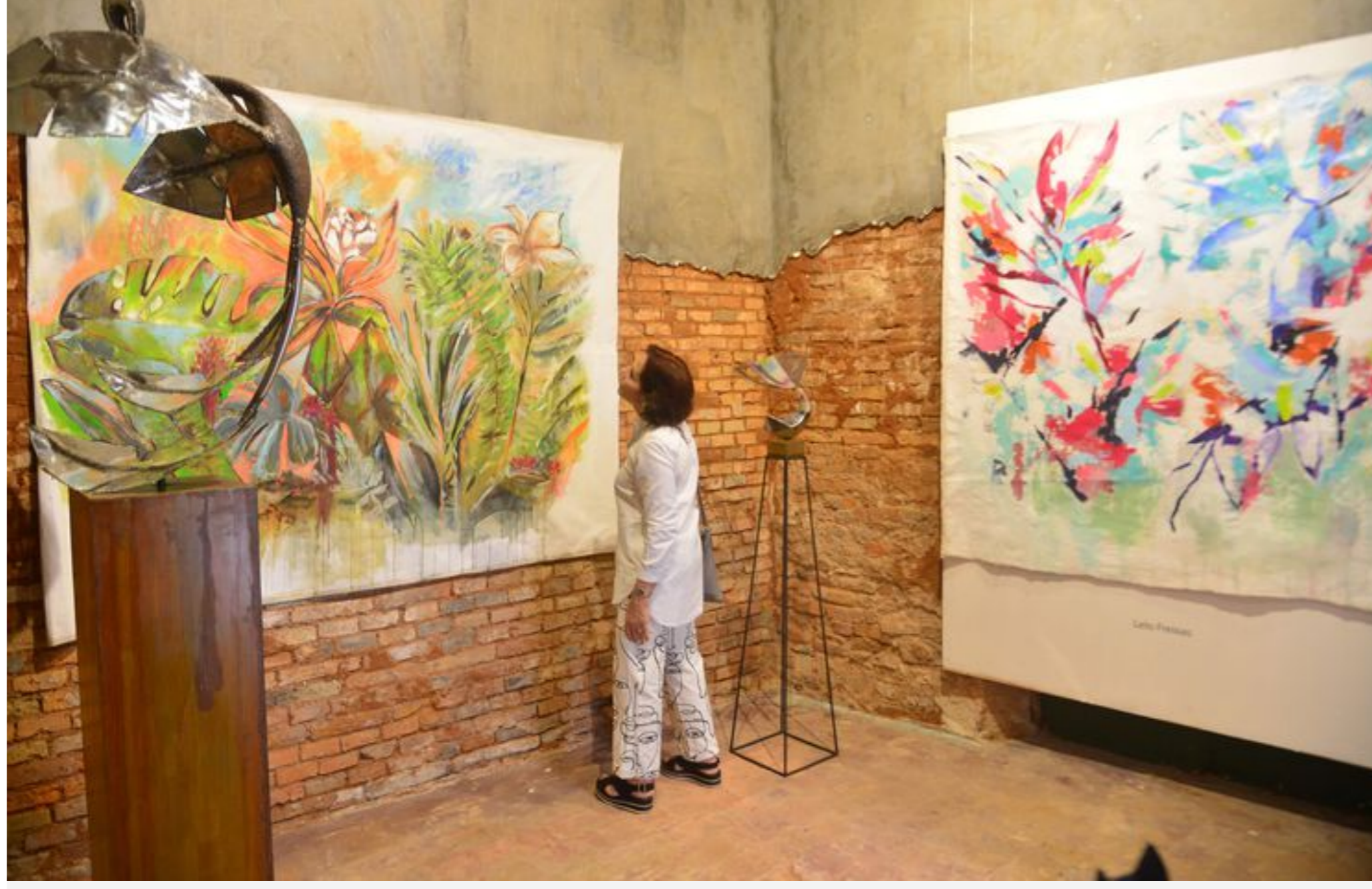
Pinturas, esculturas, fotografías, instalaciones y más se pueden encontrar en las diferentes exposiciones que ofrece el Pinta Sud ASU.

POR MARIPI LI ALONSO 04 DE AGOSTO DE 2022, - 01:00