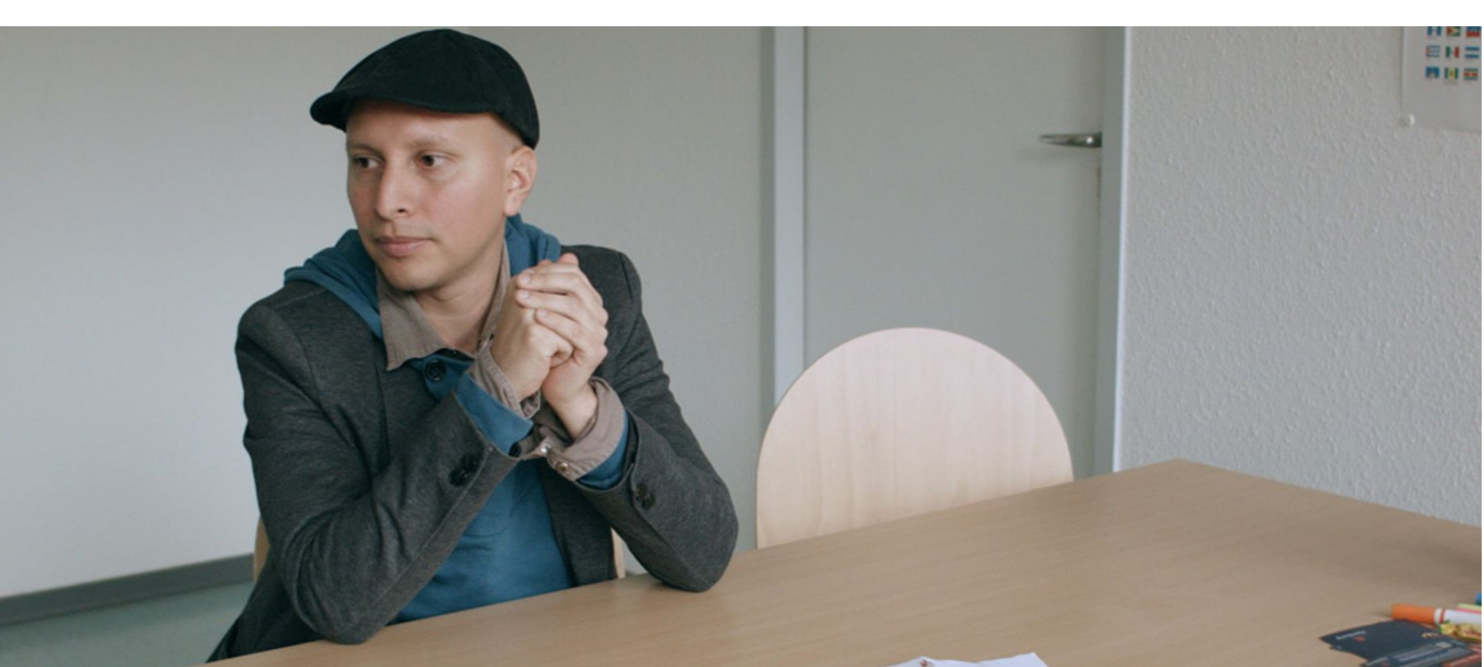
Darío Aguirre. En el país de mis hijos

Como parte del ciclo online Haus-Kino, se presentará la película En el país de mis hijos (2018), de Darío Aguirre. Con una duración de 88 minutos, estará disponible desde las 05:00 del jueves 25 de agosto hasta las 23:59 del domingo 28 de agosto (o hasta agotar visualizaciones) con posibilidad de reservar por 48 horas. El ciclo es presentado por el Goethe-Institut en Argentina, Uruguay, Chile, Perú, Colombia y Venezuela y, en Paraguay, por el ICPA Goethe Zentrum.