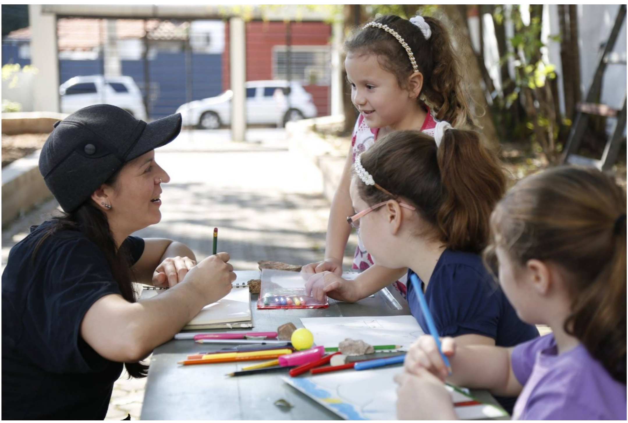
La Isla Verde en una edición anterior.

La Isla Verde es un espacio distendido y divertido para aprovechar el tiempo de las vacaciones de invierno, a propuesta del Instituto Cultural Paraguayo-Alemán (ICPA).