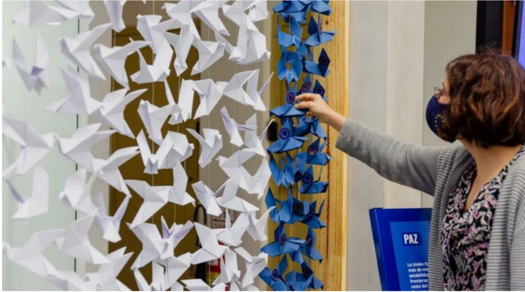
FOTO 1 DE 1 La Unión Europea presenta la campaña: 30 años en 30 imágenes.

La Unión Europea celebra 30 años de amistad con Paraguay a través de 30 imágenes