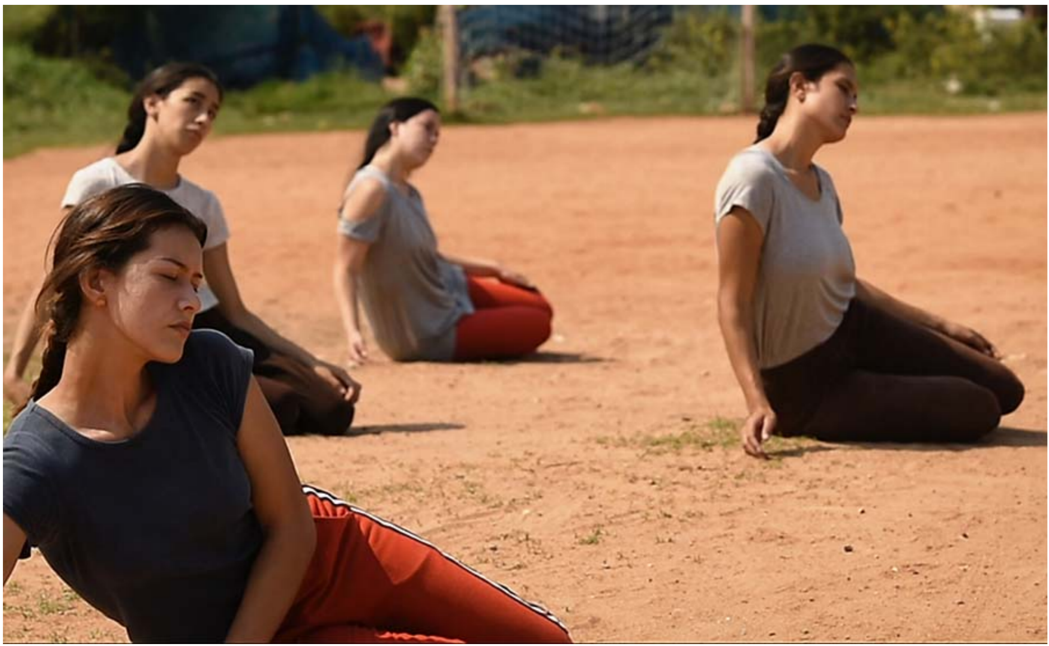
"Habitantes", 2022.

Este sábado 23 de abril el elenco Alas Abiertas estrena Habitantes , un corto documental dirigido por Javier Valdez y Sergio Núñez, con el arte sonoro y captura de sonidos a cargo de Javier Palma. Será a las 19:00 horas en el Instituto Cultural Paraguayo-Alemán y Goethe-Zentrum / ICPA GZ .