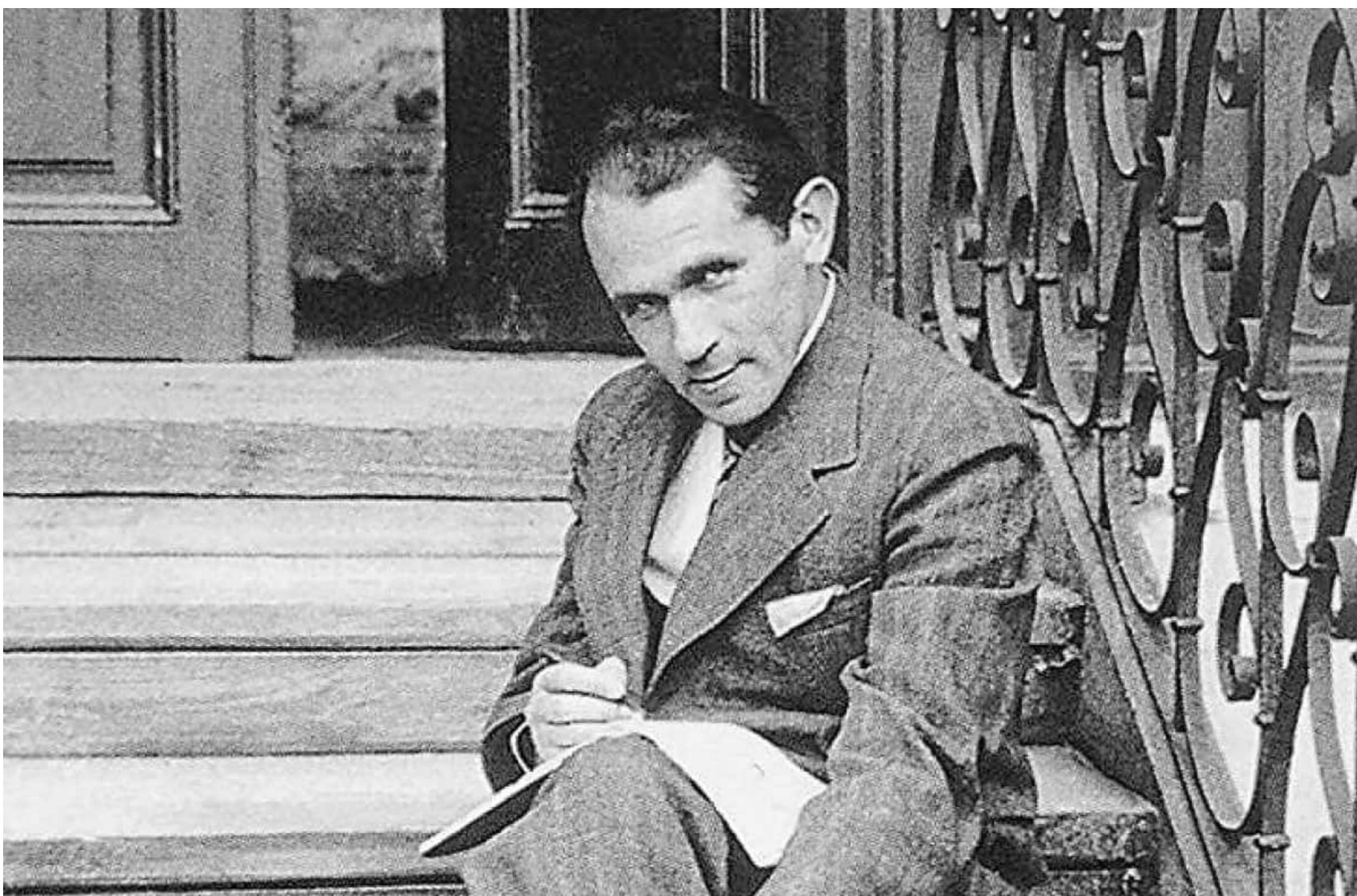
Bruno Schulz.