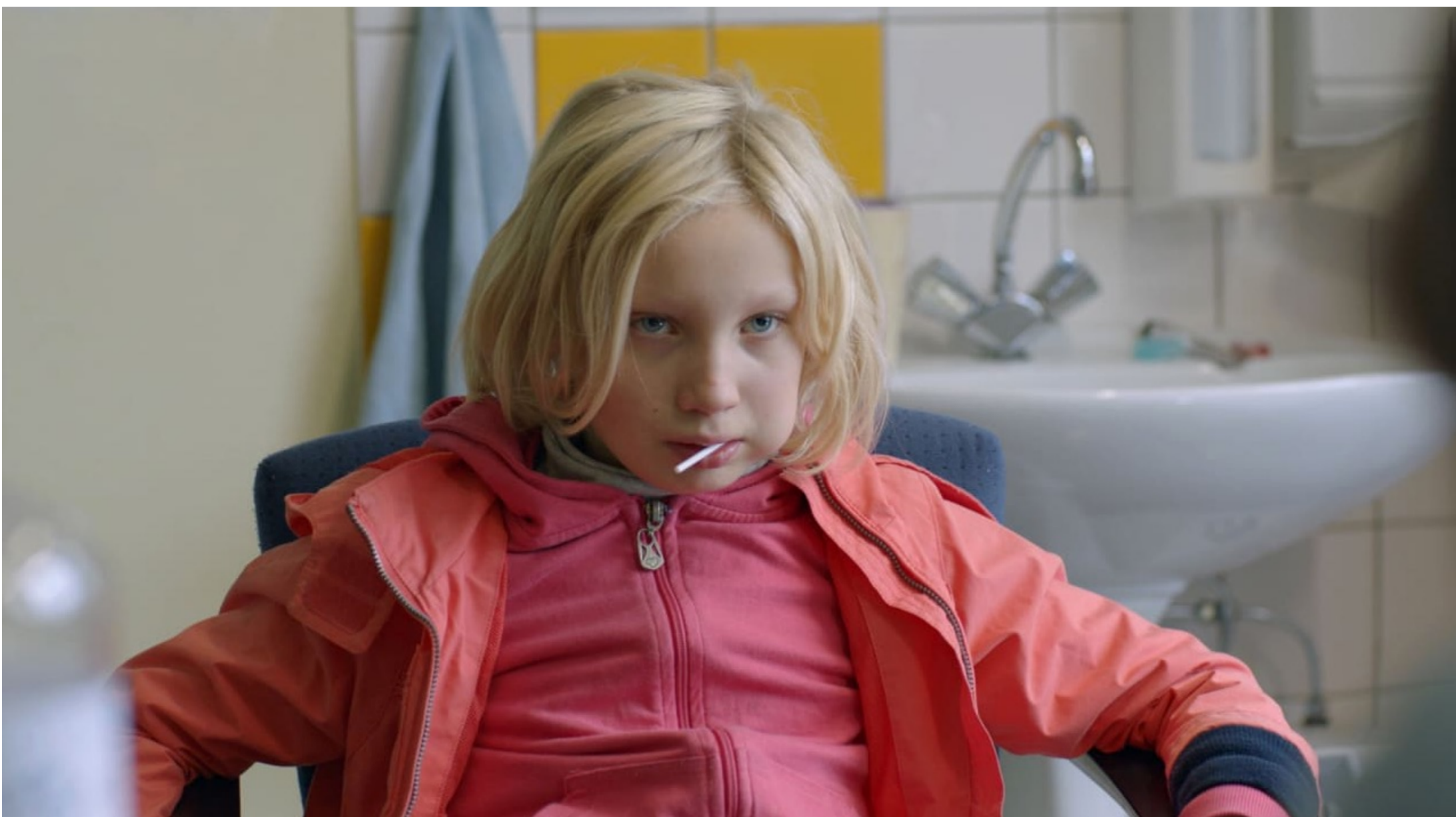
Rompeestructuras (2019, 119 min.) de Nora Fingscheidt

Haus-Kino destaca entre las novedades de la oferta audiovisual en nuestro medio, proponiendo una cita quincenal con lo más selecto del cine alemán. En efecto, los Goethe-Institut de Argentina y Uruguay, y el Goethe-Zentrum de Paraguay, inician a partir de hoy su propia plataforma de streaming, denominada Goethe on Demand, canal a través del cual podrán verse gratuitamente los filmes que forman parte de este ciclo.