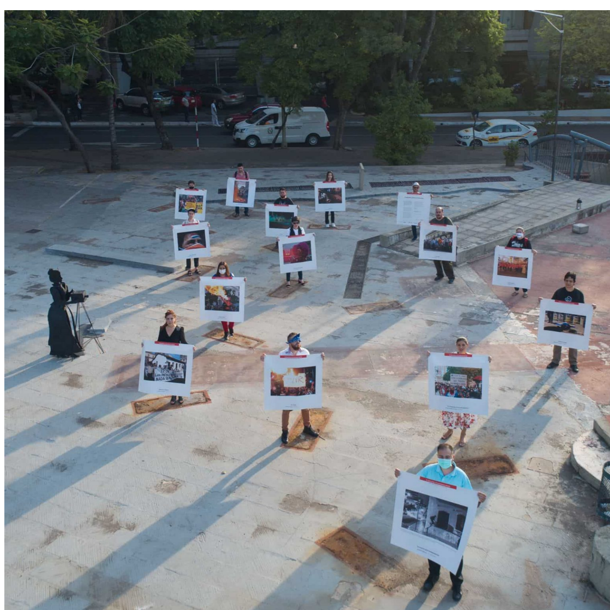
Plaza de la Democracia, Fotogalería Fulgencia Almirón, tras el retiro de los paneles por parte de la Municipalidad.

“El cierre del festival estuvo marcado por una acción colectiva en la Plaza de la Democracia, donde los artistas seleccionados del concurso El derecho a la protesta social hicieron de paneles vivos sosteniendo sus fotografías en el espacio de la fotogalería Fulgencia Almirón.