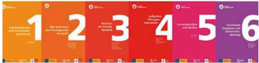
Foto: Das Basisprogramm des Deutschlehrprogramms des Goethe-Instituts

Dass man im ICPA Deutsch lernen kann, ist bekannt. Aber es gibt auch mehrere Möglichkeiten in Paraguay, Deutschlehrer zu werden: Man kann Deutsch (Licenciatura en Lengua Alemana) am ISL „Instituto Superior de Lenguas“ der Nationalen Universität von Asunción (UNA) studieren und somit einen vom Bildungsministerium anerkannten Bachelortitel erhalten. Man kann sich aber auch für die Fort- und Weiterbildungsreihe „Deutsch Lehren Lernen“ (DLL) des Goethe-Instituts entscheiden, die die Teilnehmer auf den Beruf „Lehrkraft für Deutsch als Fremdsprache (DaF)“ vorbereitet oder schon ausgebildete DaF-Lehrkräfte weiterbildet.