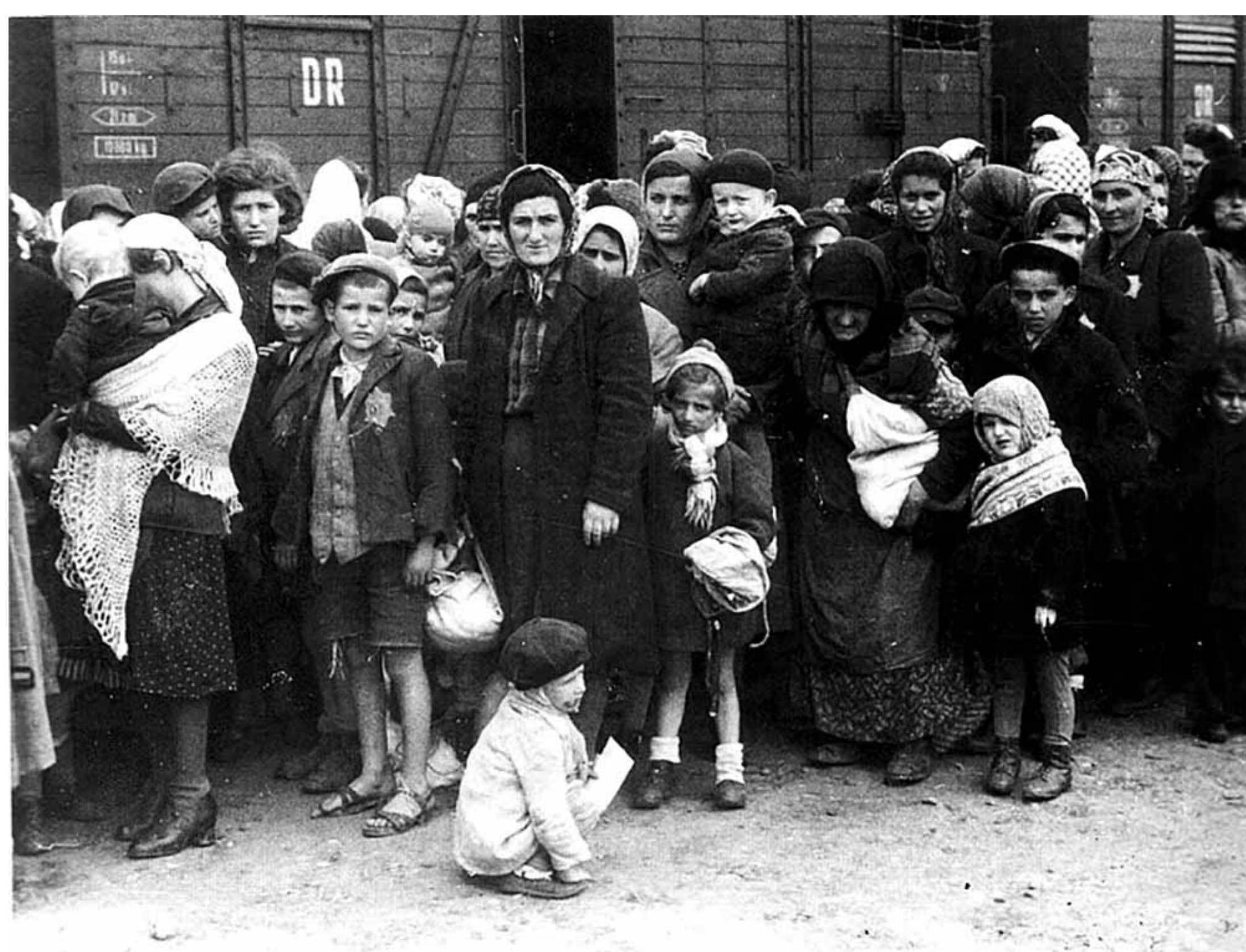
Víctimas llegadas de Hungría al campo de exterminio de Auschwitz en 1944.

Como parte de las actividades de conmemoración de las víctimas del Holocausto judío, el próximo 27 de enero la Organización de las Naciones Unidas (ONU) invita al conversatorio "¿Por qué negamos la historia?"