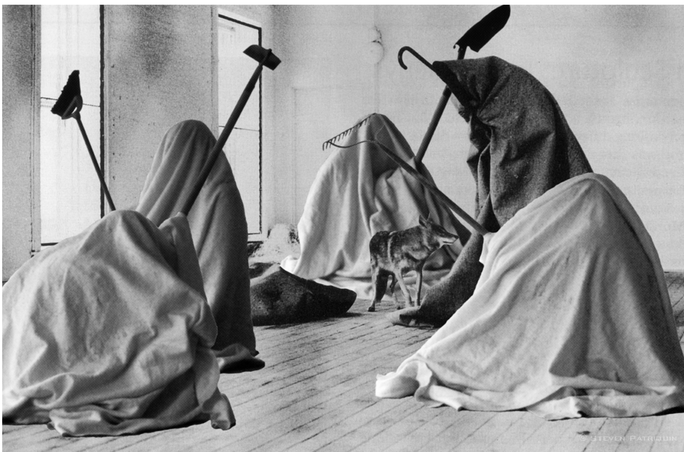
Joseph Beuys, "Me gusta América y a América le gusto yo", 1974

El Instituto Cultural Paraguayo Alemán-GZ, con apoyo del Goethe Institut y en el marco de las celebraciones del mes europeo, continúa con su ciclo de cine al aire libre este 11 de mayo a las 17.30 horas, en su sede de Juan de Salazar 310 c/Artigas.