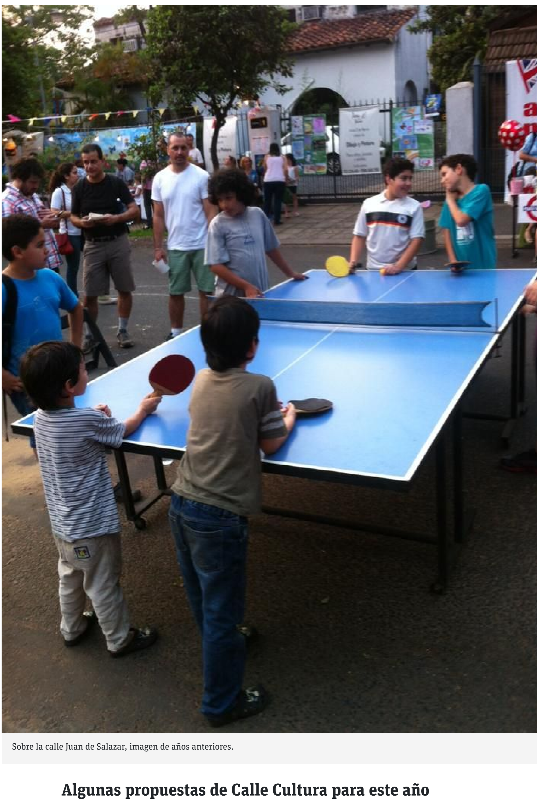
Sobre la calle Juan de Salazar, imagen de años anteriores.

Este año se repite por eso lo que más le gustó a la gente. ¿Puede adivinar? La búsqueda del tesoro, esta vez con un foco centrado en la recuperación de la memoria barrial del barrio San José a través de relatos recibidos en las redes y entrevistas, involucrando a familias que crecieron en esta zona. También se lanza la segunda edición del concurso de intervenciones urbanas ligeras, con un nuevo foco: mejorar la caminabilidad sobre el eje cultural de la calle Juan de Salazar , a través de propuestas artísticas para repintar las franjas peatonales despintadas o inexistentes y la incorporación de veredas accesibles .