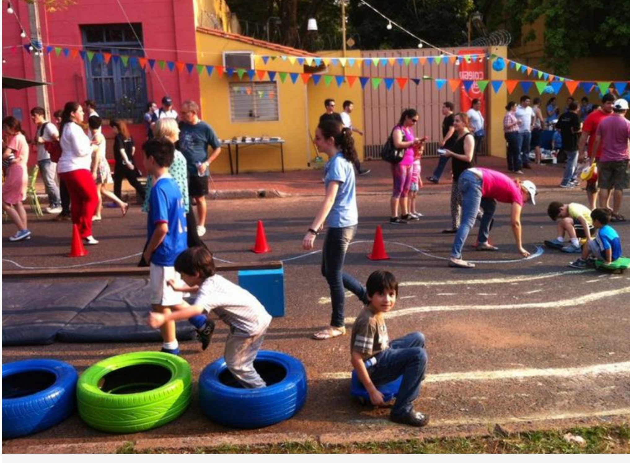
Actividades para todas las edades ofrece Calle Cultura.

La primera edición de Calle Cultura fue en 2014, y en 2020 no se pudo realizar debido a las condiciones sanitarias, pero decidieron dividir la actividad que aglomeraba a tantas personas en 5 distintas propuestas: un concierto al aire libre , teatro al aire libre , un concurso de intervenciones urbanas ligeras , cuatro sábados de búsqueda del tesoro por los barrios San José y Las Mercedes y el Parque Caballero .