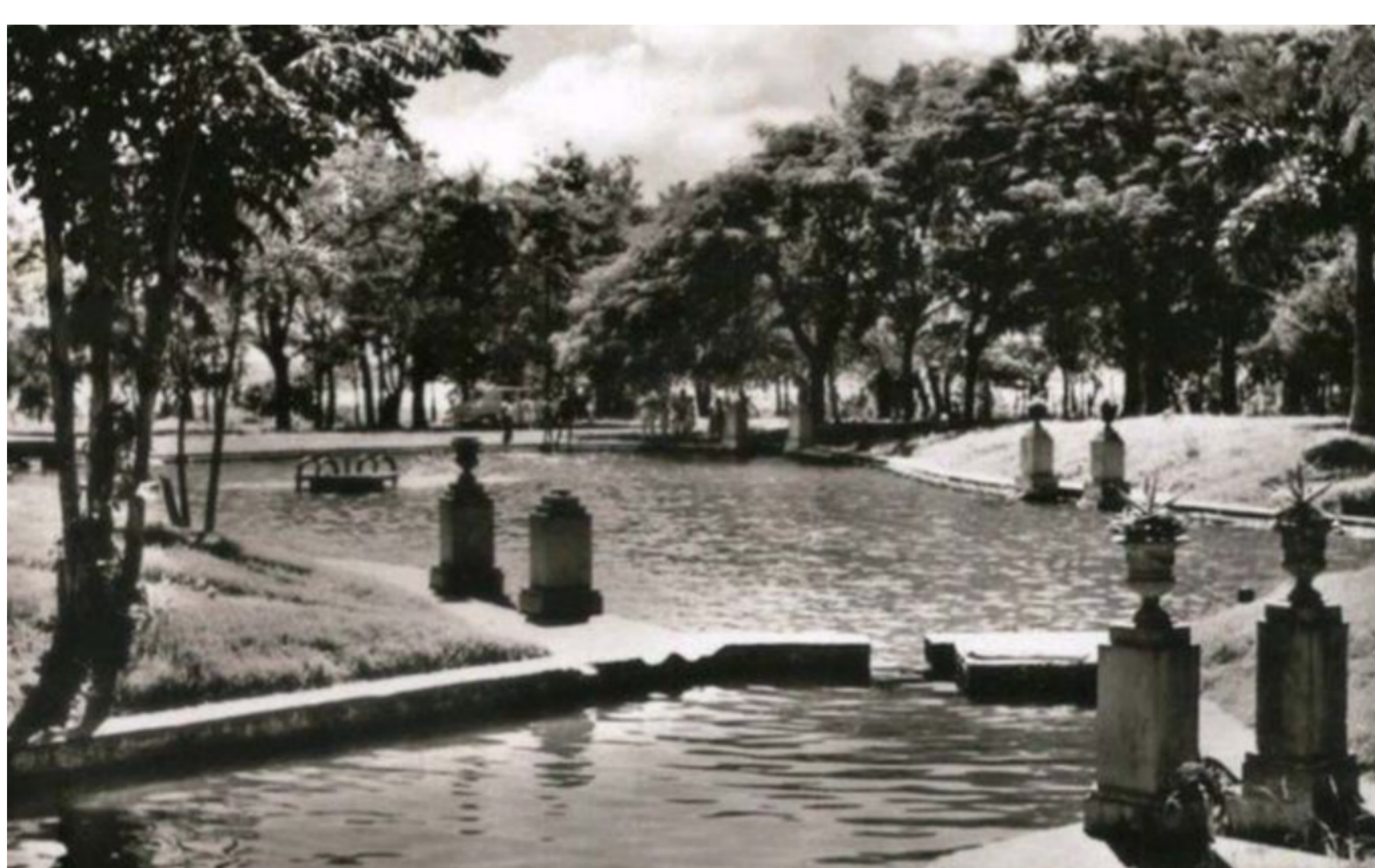
Quinta Caballero, ca. 1900.

La Ordenanza Municipal N° 895, del 31 de mayo de 1919, dispuso la adquisición de la quinta que desde 1882 pertenecía al general Bernardino Caballero y en la que vivió hasta 1912, año de su muerte. "Tiempo después del fallecimiento de Bernardino Caballero – explica el arquitecto Carlos Zárate en un artículo sobre arquitectura del paisaje publicado en la sección cultural de nuestro diario – la Municipalidad de Asunción logra adquirir el predio para convertirlo en parque público, en un hecho que fue muy celebrado por la ciudadanía según crónicas periodísticas de la época. Es el arquitecto Miguel Ángel Alfaro, por entonces intendente de Asunción, quien diseña y ejecuta un proyecto que dota al parque de diversos componentes, como terrazas, senderos, pérgolas, mobiliario y construcciones que adquieren valores cuasi esculturales, como el pórtico de acceso o el tanque de agua para riego de jardines".