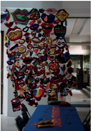
Núcleo "De boca en boca", exposición Mujeres ¿y qué más?: Reactivando el archivo Ana Victoria Jiménez , Universidad Iberoamericana, Ciudad de México, 2011.

mitad del siglo XX, así como sus innovaciones formales y conceptuales en obras que reflexionan sobre la pérdida de la memoria colectiva.