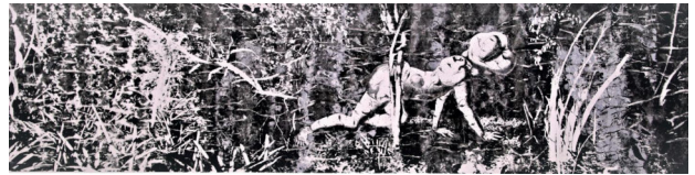
Ana Ayala Contrahierba, que sirve para curar el veneno ya tomado , 2013 Técnica mixta (Cortesía de la artista)