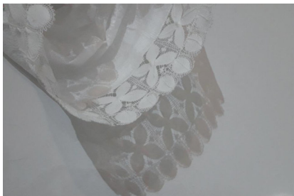
Claudia Casarino Sin título , 2019 Objetos de plastillera y randas de ñandutí