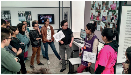
Activación de la pieza No a las maternidades secuestradas, exposición Si tiene dudas... pregunte: una exposición retrocolectiva de Mónica Mayer, Museo Universitario Arte Contemporáneo, UNAM, febrero-julio 2016.