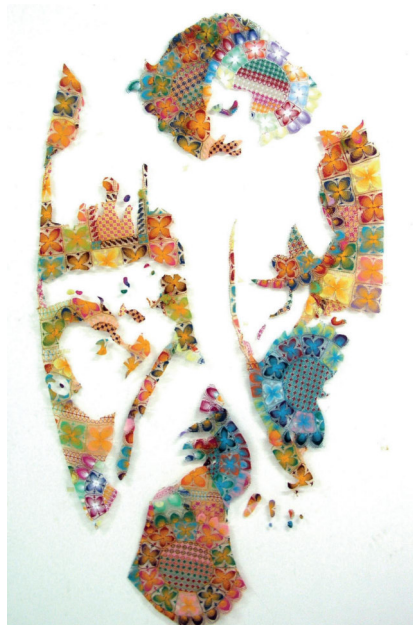
Danica Maier Intraducible , 2004 Grabado digital, dibujos, obra textil