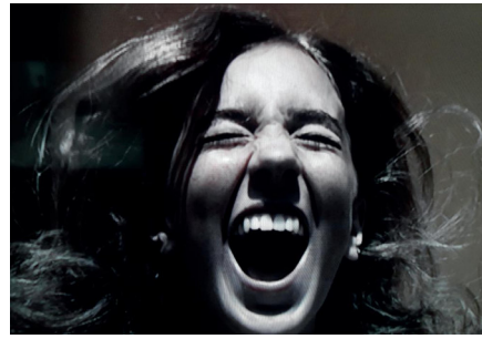
Konrad Bohley. A_fraid , 2011 Video, 4:45 min Cortesía del artista