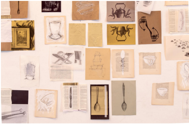
Julieta Vázquez Mansilla Sin título , 2019 Grabados, gofrados, dibujos sobre papel