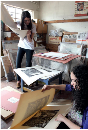
Alumnas del Departamento de Arte de la Universidad Iberoamericana Ciudad de México trabajando en el Archivo Fanny Rabel, Ciudad de México, septiembre 2012, en preparación de la muestra Para participar en lo justo: recuperando la obra de Fanny Rabel .