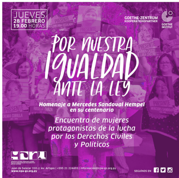
Afiche de promoción del panel Por nuestra igualdad ante la ley ICPA-Goethe Zentrum Febrero 2019

Para concluir esta breve introducción, el Instituto Cultural Paraguayo Alemán-Goethe Zentrum agradece especialmente a las destacadísimas participantes de los tres paneles, quienes han honrado con su presencia al Instituto, aportando sus vastos conocimientos en sus respectivas áreas de trabajo e investigación, en forma totalmente desinteresada.