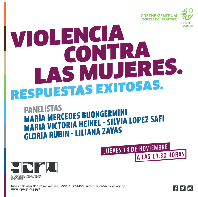
Afiche de promoción del panel Violencia contra las mujeres. Respuestas exitosas ICPA-Goethe Zentrum Noviembre 2019