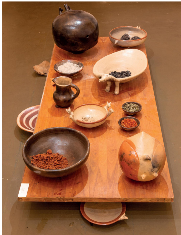
Julia Isidrez Vasija-éxtasis , 2019 Instalación de objetos cerámicos