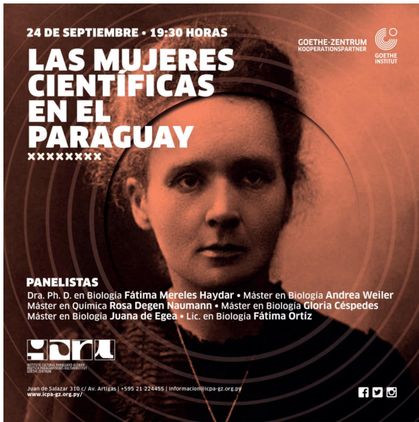
Afiche de promoción del panel Las mujeres científicas en el Paraguay ICPA-Goethe Zentrum Septiembre 2019