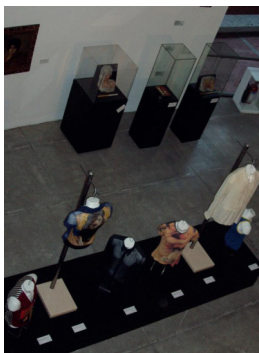
Módulo “El cuerpo vestido e investido”, exposición Sin Centenario ni Bicentenario. Revoluciones alternas , Universidad Iberoamericana, Ciudad de México, octubre-diciembre 2009.