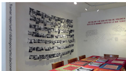
Exposición Re+acciones. Réplicas y fracturas en los archivos de arte feminista . Laboratorio Curatorial Feminista, Centro Cultural Border, noviembre-diciembre 2017.