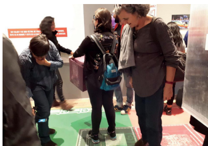
Exposición permanente De+liberaciones: luchas en diálogo. Feminismo y disidencia social . En M68. Memorial 1968, movimientos sociales. Centro Cultural Tlatelolco, Ciudad de México. Inaugurado en enero 2019.